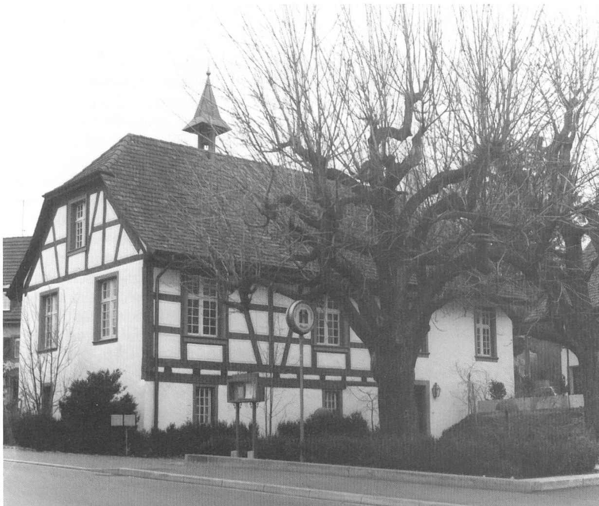
Bild 5. Begegnungszentrum Spritzehüsli heute.