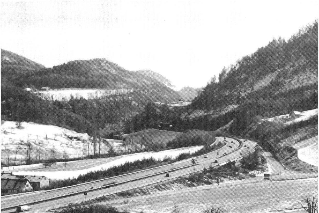
Abb. 4. Das Diegtertal oberhalb von Ober-Diegten talaufwärts gesehen. In der Bildmitte die ins Tal hineinragende Bergterrasse Oberburg mit dem gleichnamigen Hof. Sie ist von den beiden Röhren des Oberburgtunnels durchbohrt. Rechts der beim Autobahnbau 1967 abgerutschte Hang des Ränggen. Auf der linken Bildseite: unten der Einzelhof Rütiweid, oben die Rodung Witwald mit dem Herrschaftsgebäude. Dahinter der Eichenberg, auf dessen Kuppe sich die Burgstelle Schanz befindet. Foto Peter Stöcklin (Febr. 1989).

sen, aus welcher Zeit sie stammte. Handelte es sich etwa um die Überreste des vermuteten Gehöfts aus der Zeit der Burg oder einer älteren Siedlung?