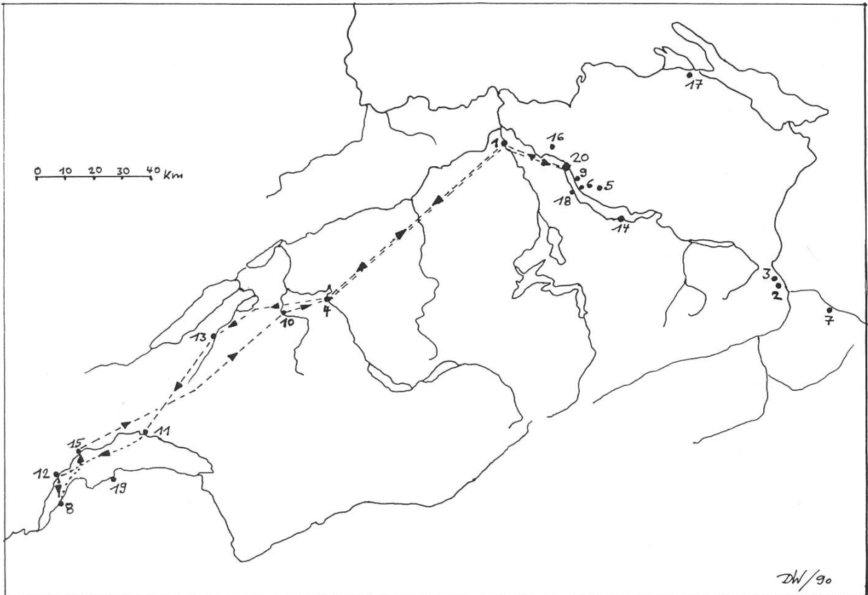
Bild 2. Die in der Lebensbeschreibung genannten Ortschaften in der Ostschweiz, die Route beim «Savoyerzug» und die von Gelpke aufgesuchten Kurbäder.