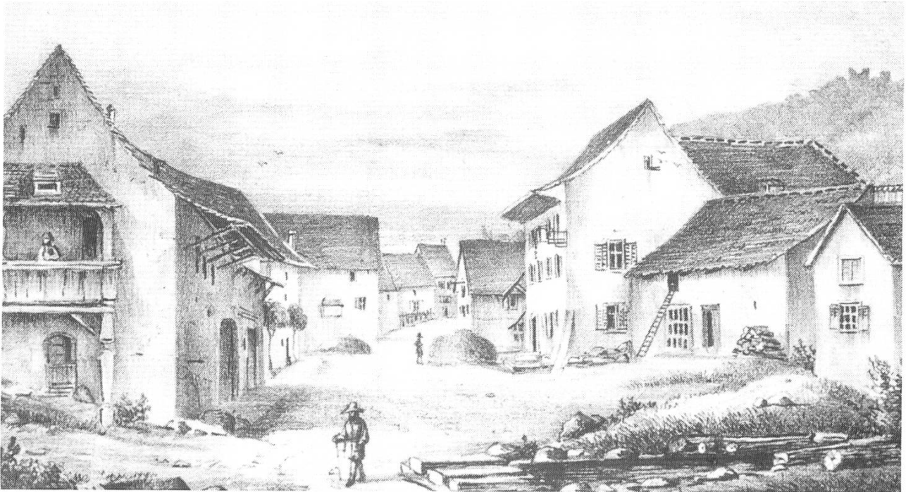
Abb. 1. Burggasse gegen Osten. Rechts Gasthaus «Schlüssel», im Vordergrund der offene Dorfbach.