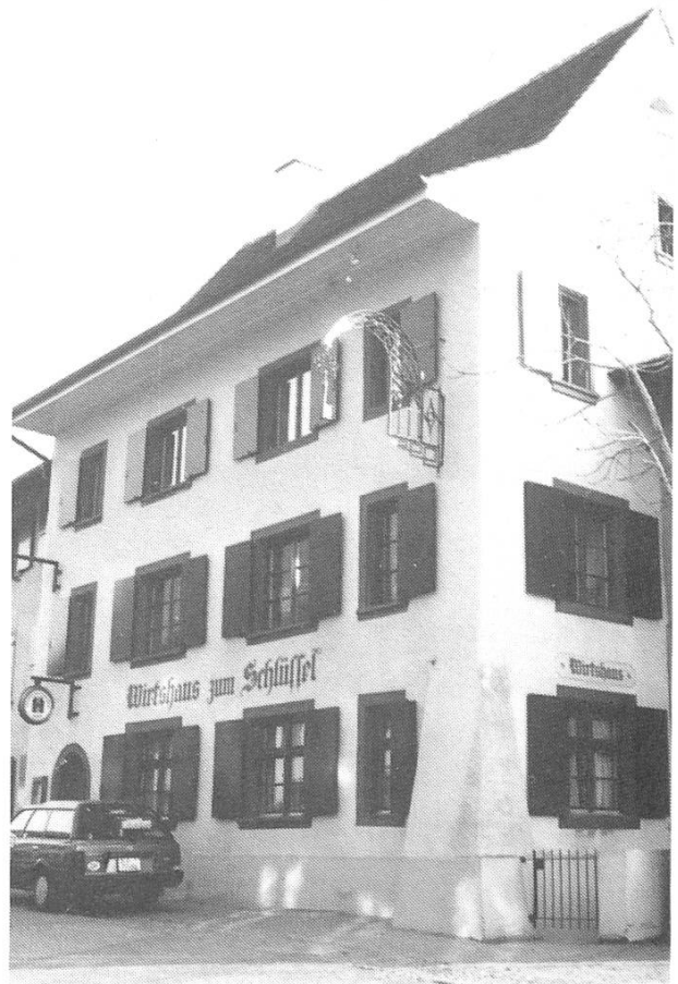
Abb. 5. Das Wirtshaus zum Schlüssel nach der Renovation von 1985.

1862, im Alter von 71 Jahren, also ein Jahr bevor er zum dritten Mal Regierungsrat wurde, verkaufte Mesmer den «Schlüssel» an Martin Dill von Pratteln. Mesmer starb am 11. November 1870 in Muttenz. Er hatte nicht nur po-