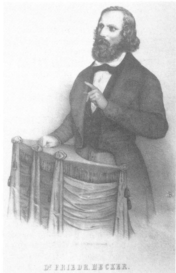
Abb. 7. Friedrich Hecker am Rednerpult. Nach einer zeitgenössischer Lithographie.

Von MuttENZ wanderte Hecker im September 1848 mit seiner Familie nach Amerika aus, wurde in Illinois Farmer und Winzer, war gemeinnützig tätig, nahm Partei für Präsident Abraham Lincoln, machte als Freiwilliger den Sezessionskrieg 1861–1865 auf Seiten