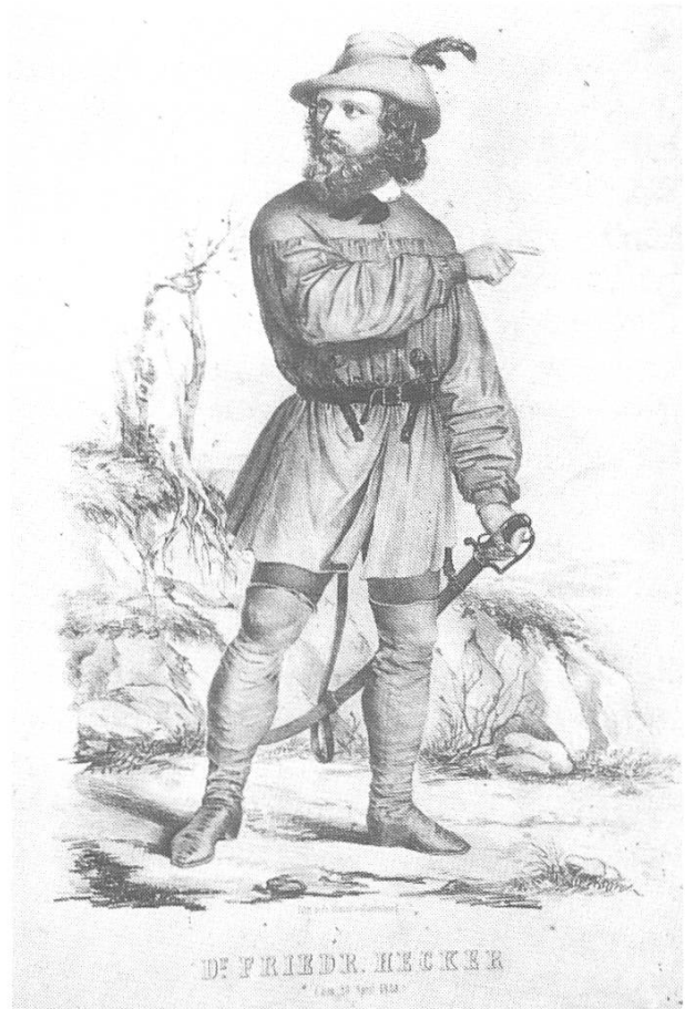
Abb. 6. Dr. Friedrich Hecker nach einer Lithographie von F. Wentzel, Wissembourg.

Hecker studierte Jurisprudenz, wurde Dr. iur. und Rechtsanwalt beim badischen Obergerichtshof in Mannheim und bald ein führender Parlamentarier in der II. Badischen Kammer in Karlsruhe (etwa dem englischen Unterhaus vergleichbar), ferner Mitglied des