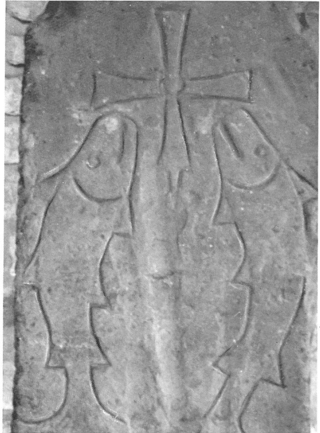
Das Wappen der Pfirters auf der Grabplatte in Kirche von Feldbach.

Eine letzte Station machten die Baselbieter in Feldbach. Hier gründeten die