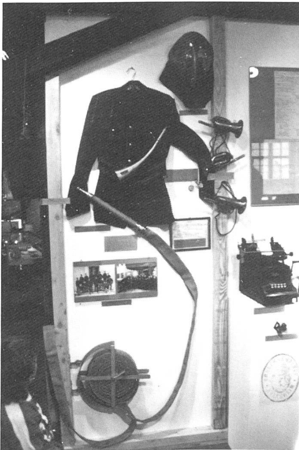
Blick in die Arlesheimer Ausstellung.