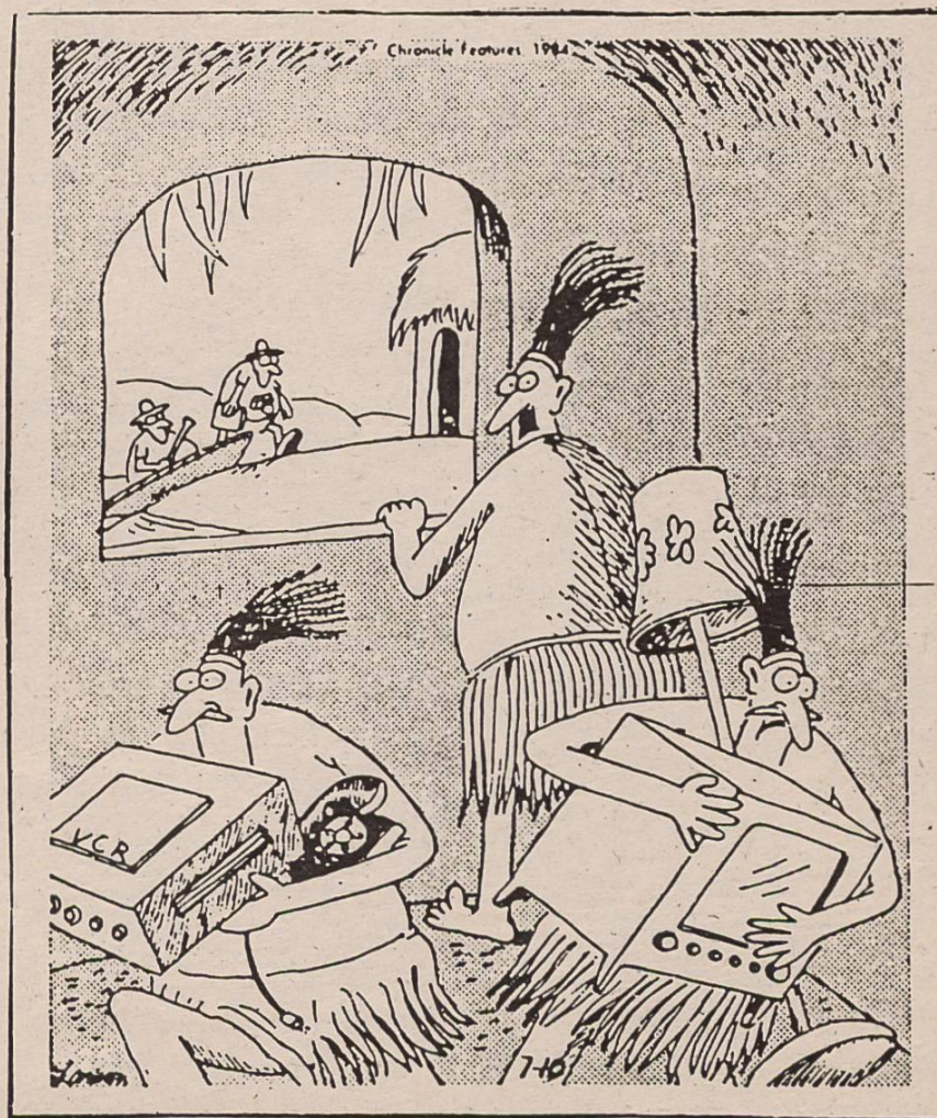
"ACHTUNG, DIE ANTHROPOLOGEN KOMMEN" GARY LARSON

Die Definitionen von Alltag sind mittlerweile sonder Zahl. Der Begriff verdankt sich in erster Linie einer kritisch-polemischen Wendung gegen den "übersozialisierten und rational verkürzten soziologischen Homunculus", und weist bereits eine stattliche wissenschaftsgeschichtliche Ahnengalerie auf, die auch seine Heterogenität und innere Widersprüchlichkeit deutlich werden lässt (11). Die Menge der konkreten Studien hat offenbar