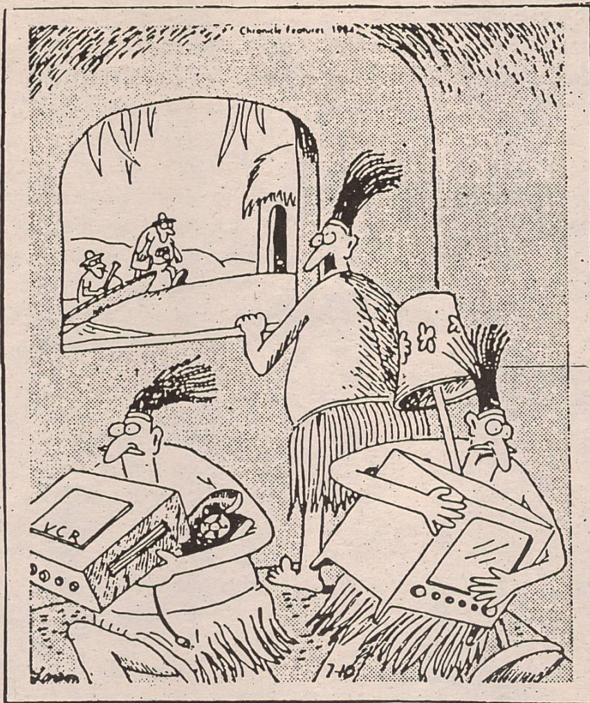
"ACHTUNG, DIE ANTHROPOLOGEN KOMMEN" GARY LARSON

darstellten. Die Menschen wurden zu "sozialen Deppen" oder zu "soziologischen Homunculi" gemacht. Der Sinn des ihnen von der Wissenschaft zugedachten Lebens erschöpfte sich gewissermaßen darin, die ihnen zugeschriebenen sozio-ökonomischen Funktionen zu erfüllen.