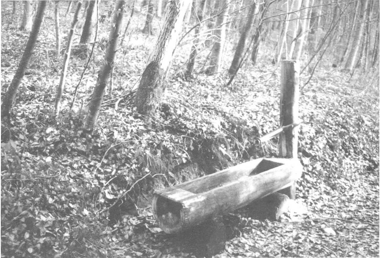
Der obere Bergbrunnen speist dieses einfache Holzbrunnlein im Hardwald.