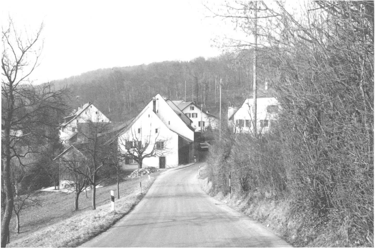
Niederhof, der tiefste Ortsteil von Ramllinsburg, besteht aus einer Reihe von alten und stattlichen Bauernhäusern.

haus Nr. 11. Dieser letztere besass ebenfalls einen eichenen Trog und erhielt einen Zufluss von einem höher in den Baumgärten gelegenen Brunnlein. Das Benützungsrecht stand ausser dem Besitzer des Nebenhauses auch den gegenüber liegenden Häusern Nr. 9 und 10 zu.