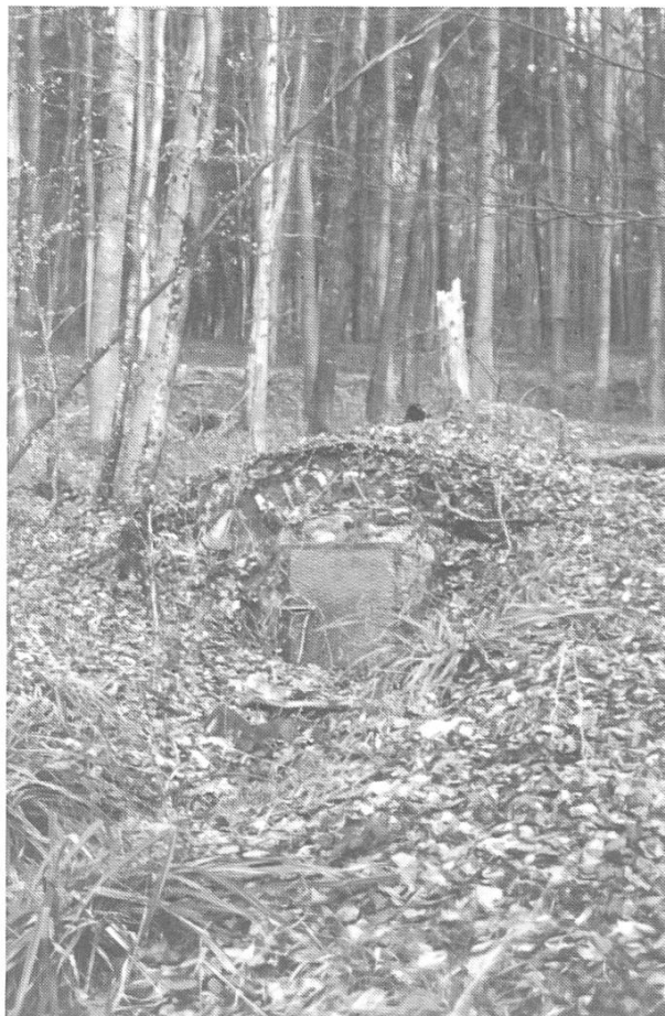
Die Brunnstube des unteren Bergbrunnens.

Zufolge des mir unterm 28. November jüngsthin eingeliferten Canzleibefehls wegen einer von der Gemeinde Ramlinsburg begehrenden Brunneleitung und dem dazu benötigten Dünkelholz, habe ich mich nebst dem Brunnenmeister von Waldenburg an den Ort verfügt und die Sache genau