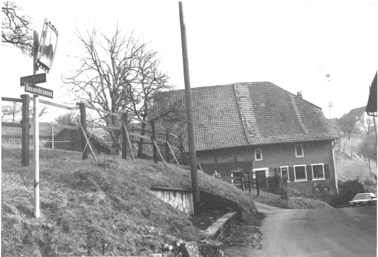
An der Strassenverzweigung auf dem Niederhof sieht der aufmerksame Passant Spuren eines Brunnens. Hier befand sich früher der Niederhöfler Gemeindesod.

Ob das Sodwasser gesundheitsschädlich war? Bestimmt hatte es nicht die Qualitäten unseres Brunnenwassers. Oft war schon der Zufluss zum Sod verunreinigt. In trockenen Sommern erneuerte sich das Wasser vielleicht während Wochen nie. Oft fielen auch Kleintiere in die Söde und verendeten und verfauten im Wasser. Aus diesen Gründen genoss man dieses Wasser in der Regel nicht roh, sondern verwendete es nur gekocht. Andererseits weiss man, dass sich der menschliche Organismus auch an Giftstoffe gewöhnen kann und dagegen immun wird. So trinken die eingeborenen Ägypter noch heute das Wasser aus dem Nil, was bei uns verwöhnten Europäern zweifellos den Typhus erzeugen würde. Sicher sind aber viele Seuchen, die im