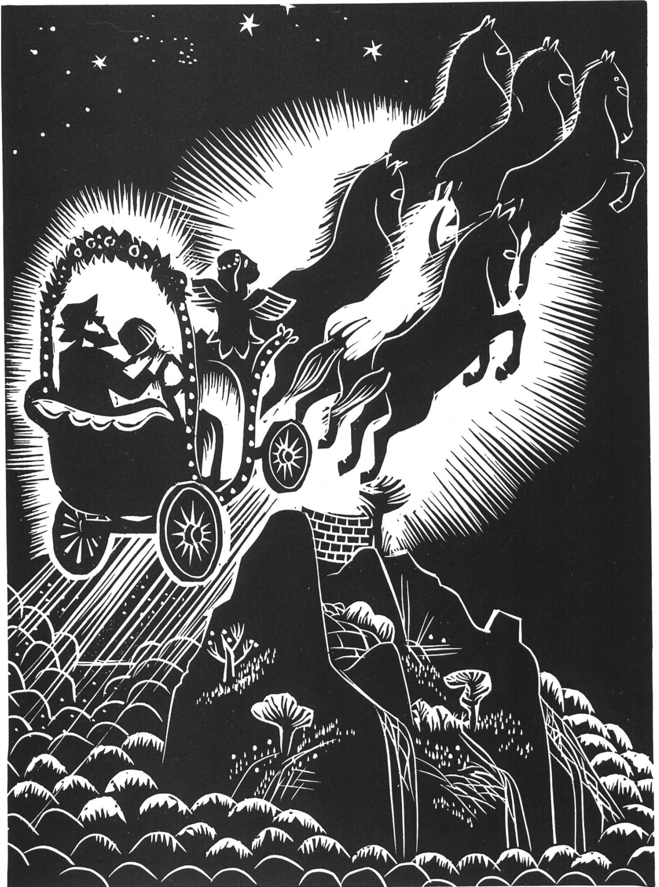
Die Reifensteinkutsche (aus dem Baselbieter Sagenbuch)