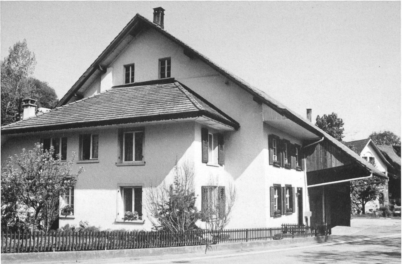
Abb. 1. Liegenschaft Hauptstrasse 53 in Mühle-Diegten 1993. Ansicht von Süden. Dahinter, etwas verdeckt, Liegenschaft Hauptstrasse 55 Sägerei Schneider, die einstige Untere Mühle , wo noch im 19. Jahrhundert eine Öle und eine Hanfreibe betrieben wurden.