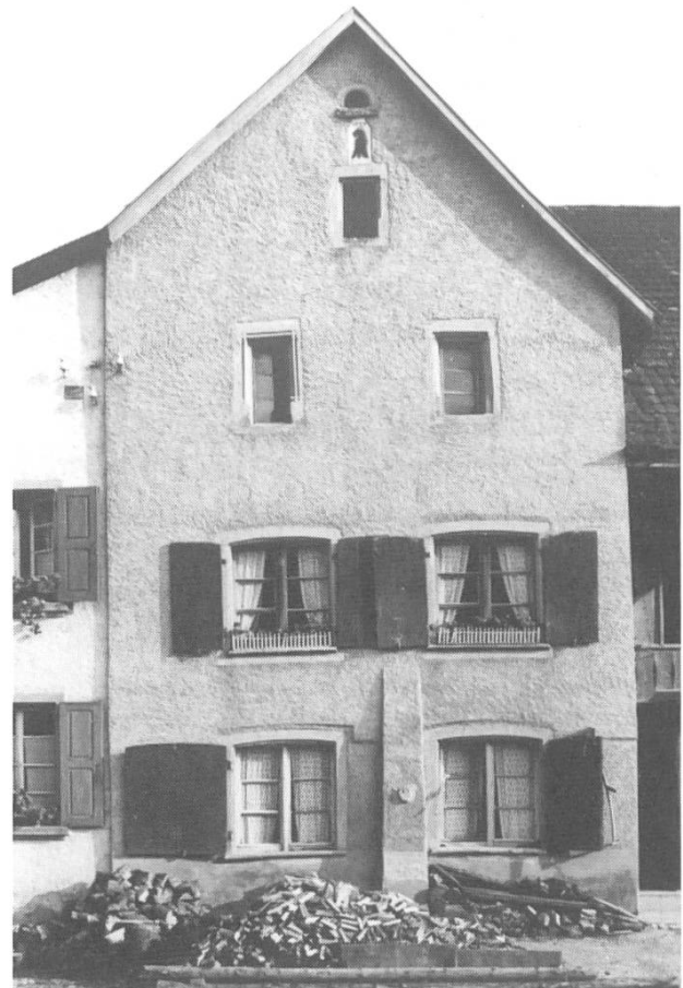
Abb. 4. Liegenschaft Bennwilerstrasse 1a/3 im Jahre 1942. Das dreigeschossige Haus trägt beim Giebelfenster die Jahrzahl 1539, die älteste in Diegten! Das Gebäude weist eine frühe Form des Steinbaus auf. Sehr wahrscheinlich ist es das älteste Steinhaus in Diegten. Der Stützpfeiler mit der Fratze wurde vor einiger Zeit abgerissen. Das Haus gehörte zu einem der beiden «Hueben»-Güter der Tenniker Kirche.