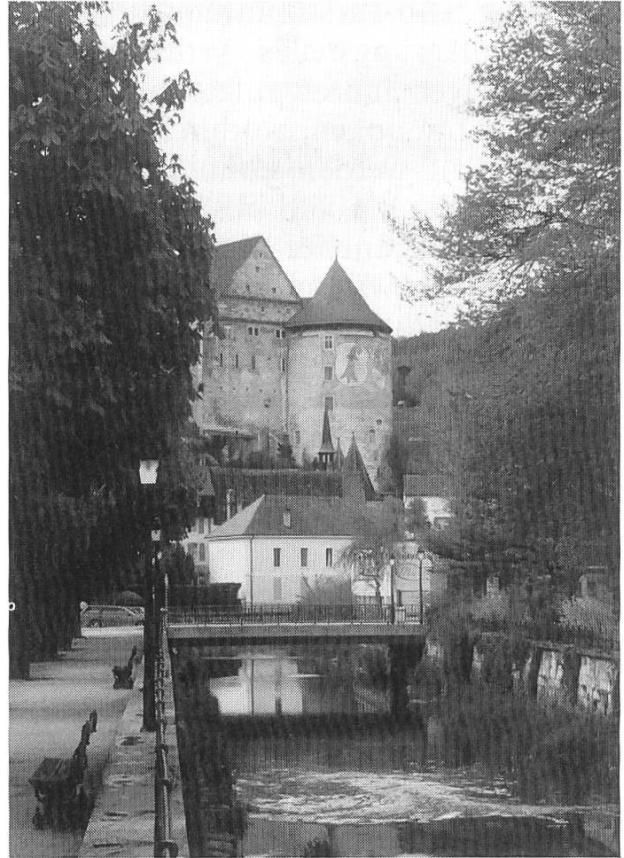
Der Hahnenturm (Tour du Coq) des fürstbischöflichen Schlosses von Pruntrut

Auf dem Wiener Kongress gelangte das fürstbischöfliche Gebiet in der Hauptsache an den Kanton Bern; kleinere Teile gingen an Basel (birseckische Dörfer), an Neuenburg und an das Grossherzogtum Baden. Den nun bernischen Gebieten wurde ein Sonderstatus innerhalb des Kantons zugestanden, aber erst die liberale Revolution von 1830/31 brachte dem Berner Jura eine demokratische Verfassung mit jurassischen Delegierten in Bern. Bereits im 19. Jh. regte sich in weiten Kreisen des Berner Jura die Idee einer Eigenstaatlichkeit. Die Ressentiments wurden vorab im katholischen Nordjura grösser durch den Kulturkampf der 1870er Jahre, als die bernischen Radikalen den Versuch unternahmen, den Katholizismus unter die Schutzherrschaft des Staates zu stellen. Der Graben zwischen dem Jura und Bern begann sich im ersten Weltkrieg zu wei-