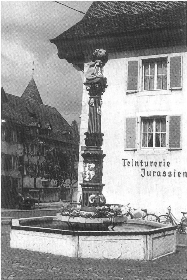
Die «Fontaine du Lion (1590) mit dem Wappen des Fürstbischofs J. Chr. Blarer von Wartensee

chen Macht auf dem jurassischen Territorium.