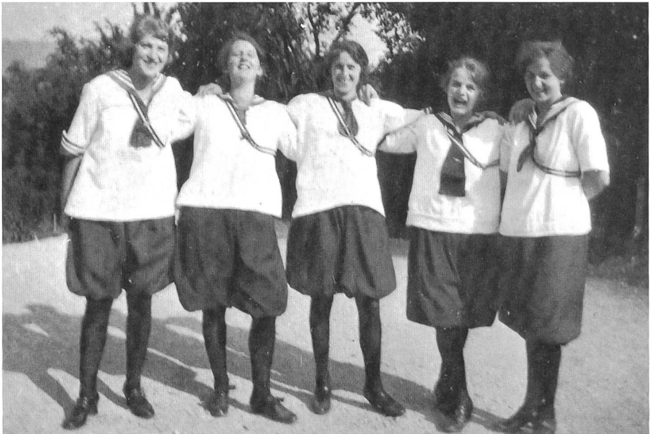
Fünf junge Liestaler Turnerinnen in Pumphosen, 1919.

sich nicht in die gilet- und hosenträgerlose Zeit schicken. Ebenso wenig wollten die Jungen mehr von den schweren «bürgerlichen» Überziehern etwas wissen; sie kauften sich Konfektions-Mäntel, auch Regenmäntel. Stärksten Unwillen erregten sie, wenn sie sich für die verrückte amerikanische «Negermusik» begeisterten und in den nach unten übermässig erweiterten Charlestone-Hosen und den spitzen Shimmy-Schlappen tanzen gingen (1929 Ormalingen, Fastnachtzettel).