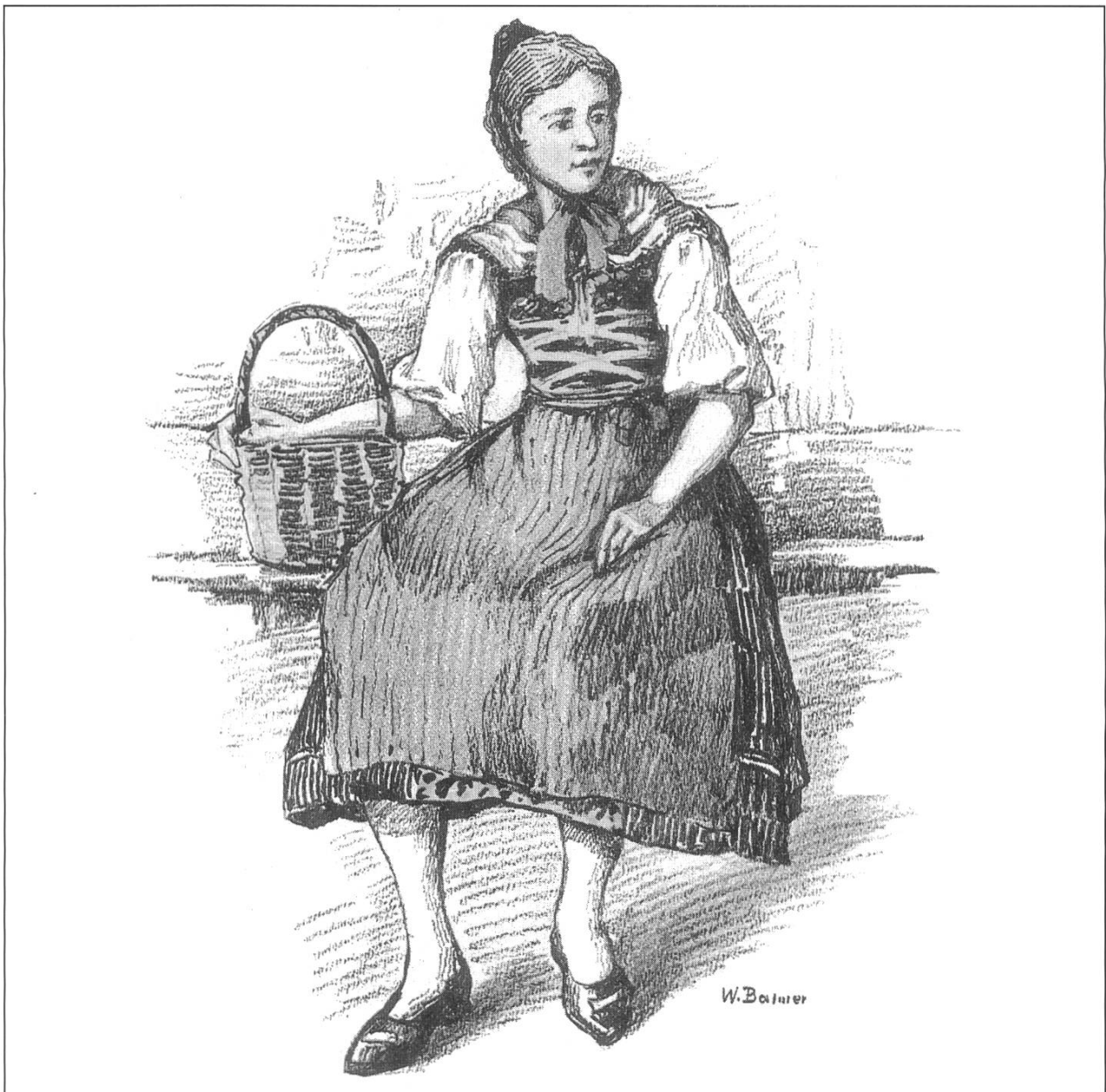
Baselbieter Trachtenfrau. Farbige Zeichnung von Wilhelm Balmer für eine Postkartenserie der Schweizerischen Vereinigung für Heimatschutz, 1925.

wäre verfehlt», und: «Von einem allgemeinen Tragen der «historischen» Tracht breitester, aller Stände umfassender Volkskreise [...] kann keine Rede mehr sein» (Baselbietertracht 4). Geblieben und ihrem Auftrag treu geblieben sind die Trachtengruppen, die in ihren Kreisen Landstracht und Landesbrauch liebevoll pflegen, während die Masse des Volks andere Wege gegangen ist.