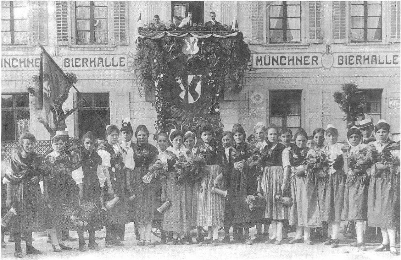
Sissacher Trachtenfrauen am Banntag 1919.

kunft als Baselbietertracht (vor allem für Frauen) zu gelten habe: «Die Baselbietertracht. Kurze Beschreibung und Anleitung für deren Neuanfertigung», Liestal 1932 (im folgenden abgekürzt: Baselbietertracht).