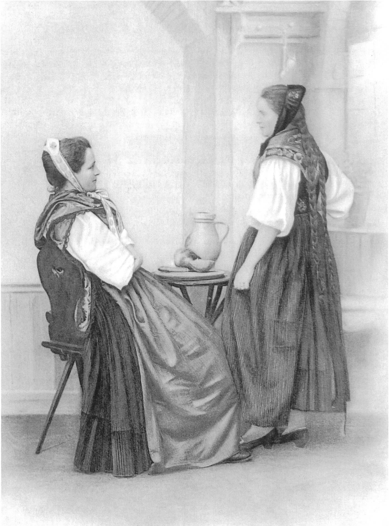
Baselbieter Trachtenfrauen aus dem Ende des 19. Jahrhunderts. (Repro aus der 36teiligen Farblithoserie, 1898 hgg. von Julie Heierli zur Eröffnung des Schweizerischen Landesmuseums in Zürich).