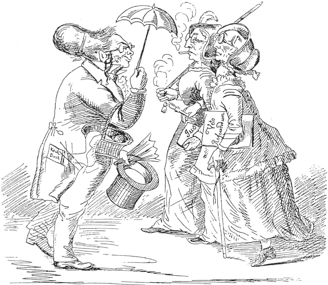
«Guten Morgen, meine H e r r e n !». Karikatur aus «Postheiri» 1868, S. 135.

schienen), ein dunkelgefärbtes Füürdech Fürtuch, Halbschürze), das übers Kreuz gebundene Halstuch. Junge Mädchen und auch Frauen gingen im Sommer oft barhäuptig, im Winter schützte sie ein Ohrentüchlein oder eine Art Haube (capuchon), der Chappeschang (Hemmen), Chappischong (Liestal). In schlecht geordneten Verhältnissen boten Frauen «mit dem alltäglichen Tschuppel , dem Schlämpirock und einem zerfetzten Fürtuch » einen wenig erfreulichen Anblick (Breitenstein 1860).