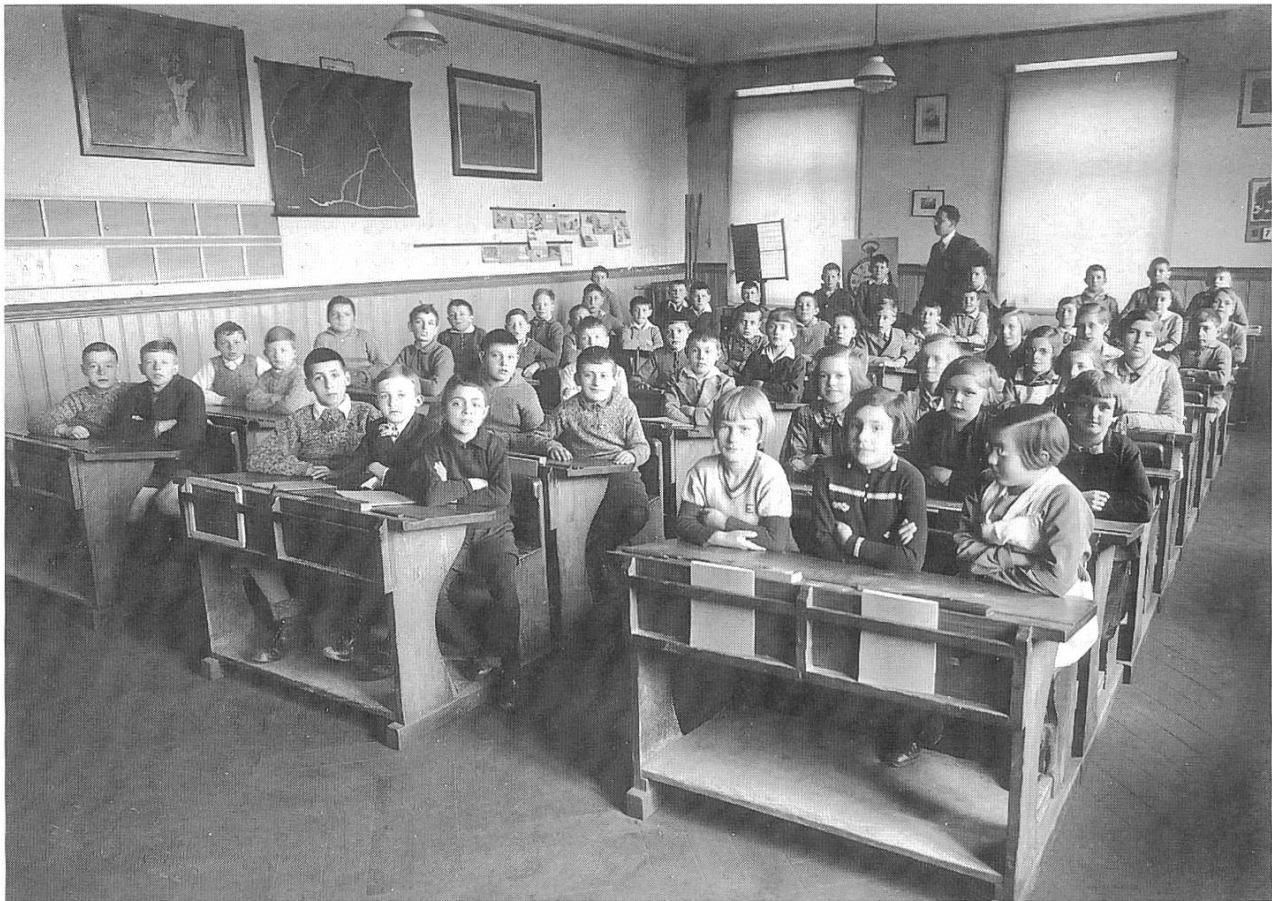
Eine Primarschulklasse in Binningen, um 1935.

keln. [...] Modetorheit!» (BZ 1911, 31. Mai). Eher begriff man die jungen Velofahrerinnen, die statt der hochflatternden Röcke lieber die immerhin dezenteren Rockhosen oder Hosenröcke trugen.