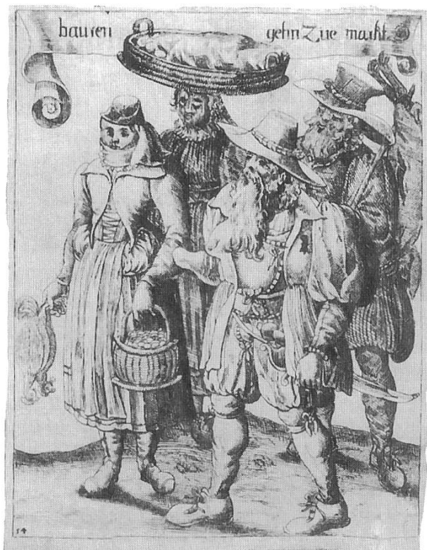
Bauern gehen auf den Markt, um 1630. Bild aus der Kostümfolge von Hans Heinrich Glaser (Repro aus: Alfred R. Weber, Was man trug anno 1634. GS-Verlag Basel, 1993).

ter genähert» (Frenkendorf). Mehrfach wird der Standesunterschied betont; z. B. «Beim kernigen [!] Teile, dem eigentlichen Bauern und Landarbeiter, hat das Währschafte und Selbstgemachte noch immer seinen Vorrang» (Therwil); oder: «Während der solidere [!] Theil (Ackerbauer und Handwerker) noch ziemlich die frühere einfache Tracht beibehalten hat, sehen wir die Fabrikarbeiter mehr die Neuerungen und die Stadttracht annehmen» (Binningen). Was mit «städtisch» – zunächst natürlich Basel-städtisch – eigentlich gemeint ist, zeigt: «Es herrscht wie überall die sog. französische oder städtische Tracht» (Rickenbach), oder