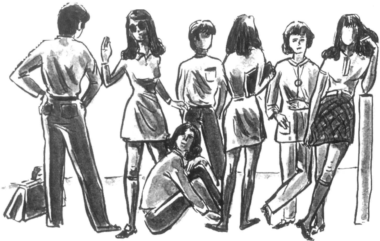
Liestaler Schülerinnen und Schüler 1969. Tuschzeichnung von Ernst Probst. (Repro aus Heimatkunde Liestal. Liestal 1970, S. 365).

werdenden Minijupes, auch die Hot-pants.