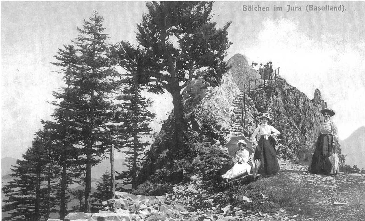
Modisch gekleidete Touristinnen auf der Bölchenfluh. Postkarte um 1905.