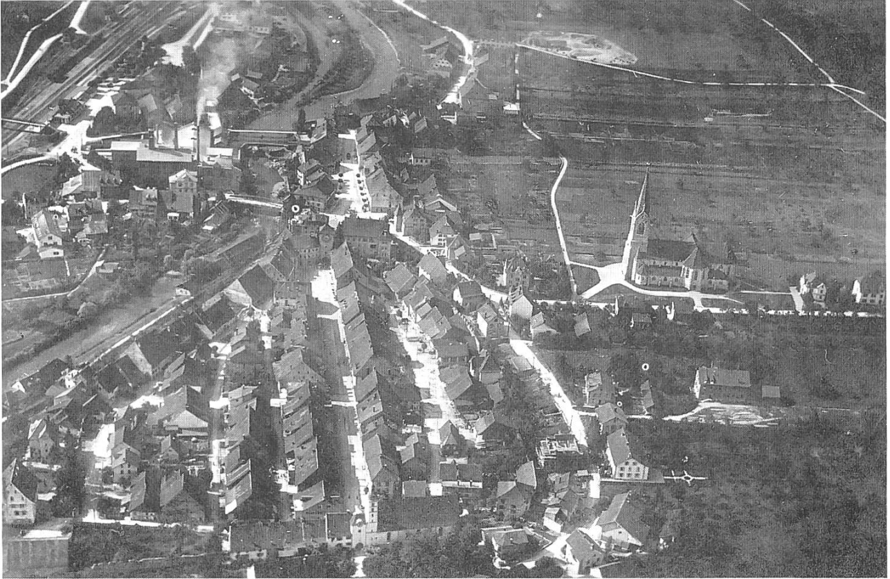
Laufen um 1900

chese, den berüchtigten Zuchthausknall. In der Anstalt habe sich Schmidlin ruhig verhalten, man konnte ihn im grossen Schlafsaal lassen, er hilft mit bei Wartungs- und Aufsichtsarbeiten. An Intelligenz mangelt es ihm laut Gutachten keineswegs, die Bildung ist erstaunlich hoch, ebenso das Gedächtnisvermögen. Kein Trinker und ein williger Schaffer: So solid wie bei Schmidlin ist die Lebensführung eines Arbeiters seines Standes sonst keineswegs. Doch das ständige Misstrauen und die Unleidigkeit sind für den Arzt typische Zeichen einer Psychose. Das sei kein Wunder, bei diesen Familienverhältnissen: Grossvater und Vater Schmidlin haben sich beide umgebracht, die Mutter gilt als hysterisch und soll schon längers in der Friedmatt, der Basler Irrenanstalt, interniert gewesen sein. Im Heimatdorf der Mutter spricht man nur noch von der Sippe der Gurgelabschneider. Da scheint für viele der Weg