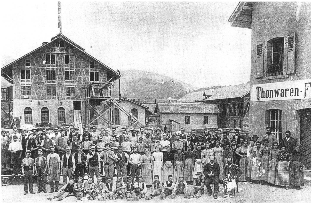
Die Belegschaft der Tonwarenfabrik um 1920