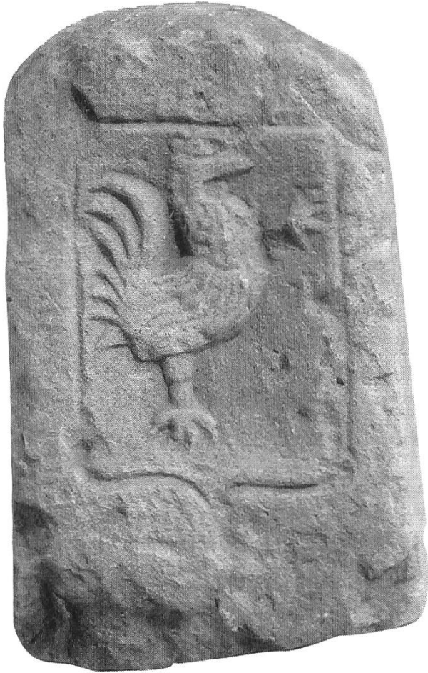
Güterstein mit Blarer-Wappen (Museum Aesch;)