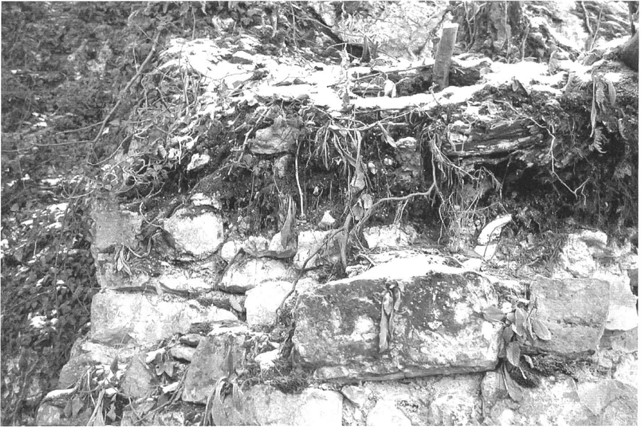
Abb. 3: Ettingen, Burg Fürstenstein. Schäden im Bereich des Einganges. Das Wurzelwerk hat die Mauerkrone vollkommen zerstört, so dass Wasser in den Mauerkerndringt.

cher Verein an die Kantonsarchäologie herantreten waren, erarbeitete die Kantonsarchäologie 1991 ein Sanierungskonzept und unterbreitete es der Gemeinde, die als Besitzerin für den Unterhalt der Burg verantwortlich ist. Sie bot der Gemeinde umfangreiche Hilfe für die Wiederherstellung der Ruine an und wies auch darauf hin, dass sie bei der Beschaffung fehlender Mittel behilflich sein werde. Aufgrund anderer Prioritäten war es der Gemeinde jedoch nicht möglich, das Projekt in Angriff zu nehmen. Die Kantonsarchäologie wird den Zustand der Burg weiter beobachten.