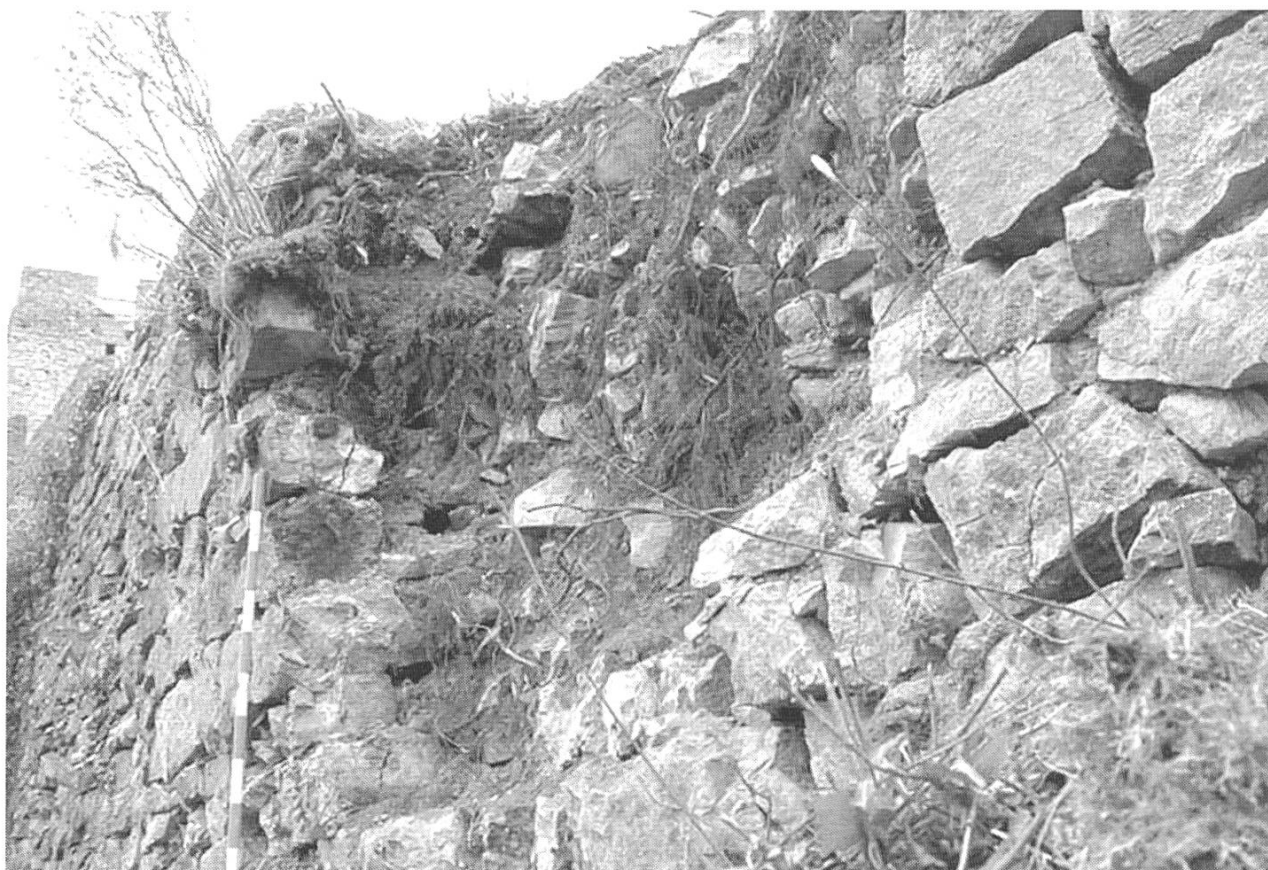
Abb. 7: Waldenburg, Schloss Waldenburg. Der Mauerausbruch am «Neuen Schloss». Es ist deutlich erkennbar, dass auch das umliegende lockere Mauerwerk erneuert werden muss.

Mauer nur noch die untersten Steinlagen vorhanden waren, welche nicht mehr erhalten werden konnten, wurde ihr Fundament durch eine Betonmauer ersetzt.