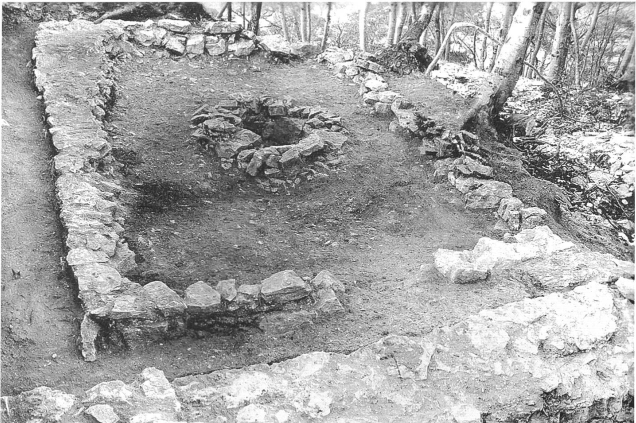
Abb. 11: Pratteln, Madeln. Ein Ausschnitt der 1939/40 freigelegten Mauerbefunde.

Die Öffentlichkeit dagegen möchte etwas sehen, möchte die Burgruine erleben können. Da die oft nur spärlich erhaltene Originalsubstanz als historische Quelle zumeist nur für Fachleute lesbar ist, verlangt die Öffentlichkeit nach mehr An-