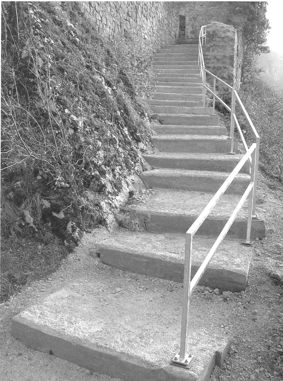
Abb. 10: Waldenburg, Schloss Waldenburg. Die 2002 in moderner Form erstellte Treppe, die sich bewusst vom historischen Baubestand abheben soll.

Als Beispiel eines Neubaues in einer Burgruine ist die 2002 erstellte Treppe auf der Ruine Waldenburg zu nennen. Da der vorhandene Ausgang bereits mehrfach geflickt und auf der Talseite zur Sicherheit der Besucherinnen und Besucher