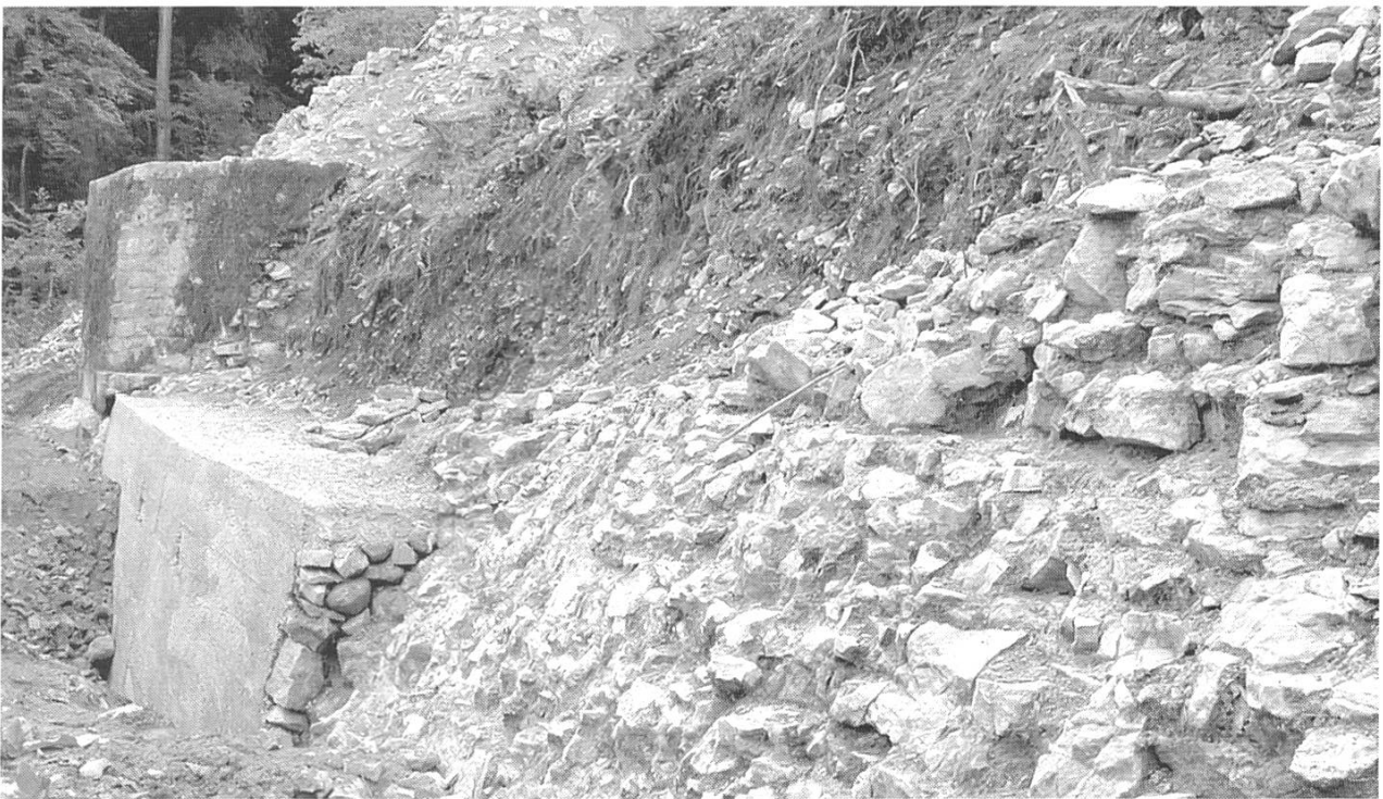
Abb. 6: Buus/Ormalingen/Hemmiken, Farnsburg. Das aus Beton erstellte Fundament für die Rekonstruktion der östlichen Beringmauer. Rechts Reste des Mauerkerne der originalen Mauer und des abgeschroteten anstehenden Felsens.