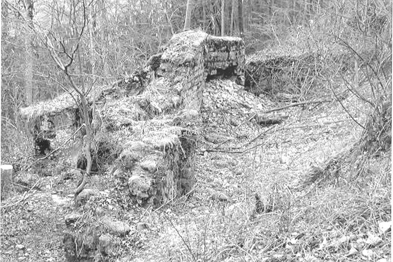
Abb. 4: Buus/Ormalingen/Hemmiken, Farnsburg. Der südöstliche Bereich der Burganlage im Frühjahr 2002 vor der Sanierung.

Gemeinde archäologisch untersucht. Teile der Anlage wurden konserviert. 5