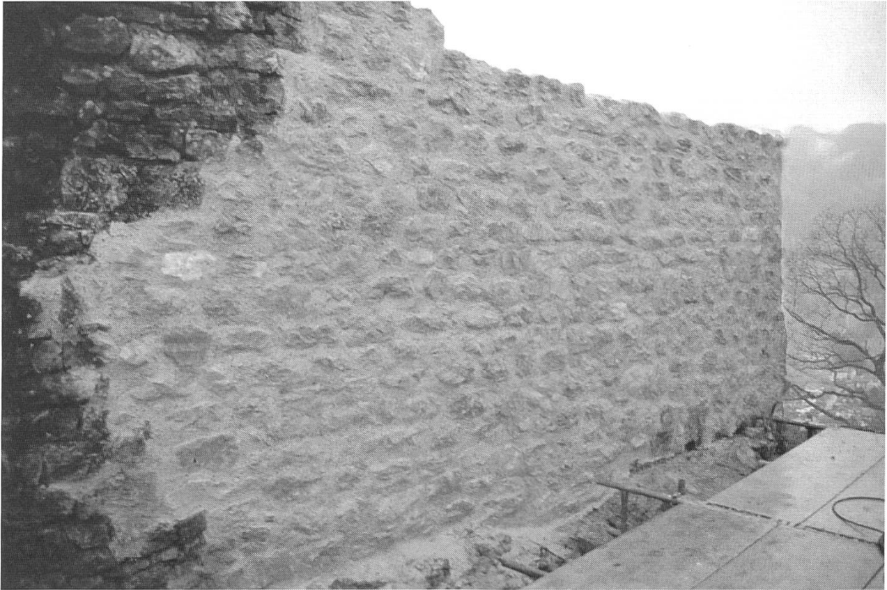
Abb. 8: Waldenburg, Schloss Waldenburg. Die sanierte Mauer am «Neuen Schloss».