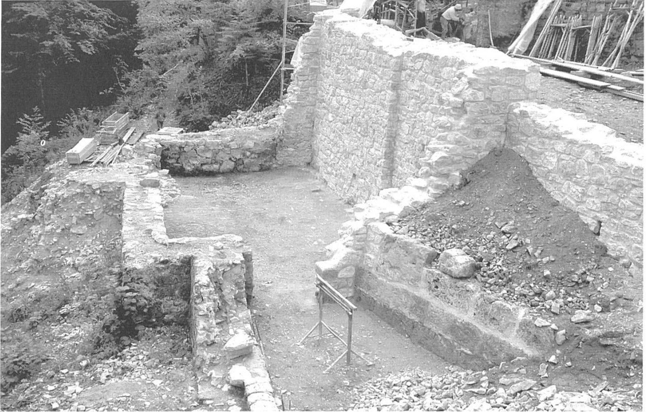
Abb. 5: Buus/Ormalingen/Hemmiken, Farnsburg. Der südöstliche Bereich der Burganlage nach der ersten Etappe der Sanierung. Teile des ehemaligen Wacht- und des Kornhauses wurden wieder neu aufgebaut.