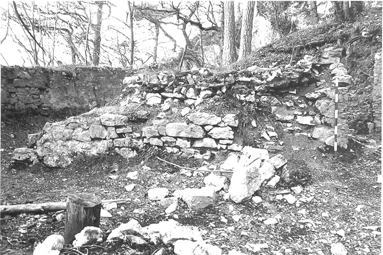
Abb. 2: Eptingen, Burg Witwald. Vom vollständigen Zerfall bedrohter Mauerabschnitt.

Der schlechte Zustand der Ruine Witwald in Eptingen, die 1909 freigelegt und gesichert wurde, war bereits lange bekannt. (Abb. 2) Insbesondere drohte ein Mauerrest in exponierter Lage abzustürzen. Nachdem Privatleute und ein örtli-