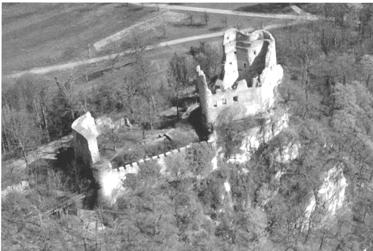
Abb. 1: Pfeffingen, Schloss Pfeffingen. Luftaufnahme von 1998.

Pfeffingen) zu sorgen und Bemühungen um eine fachgerechte Konservierung und Restaurierung von nicht kantonseigenen archäologischen Stätten, welche sich im Besitz von Gemeinden, Bürgergemeinden oder Privatleuten befinden, durch Beratungen, Arbeitsleistungen oder die Gewährung von finanziellen Beiträgen zu unterstützen.