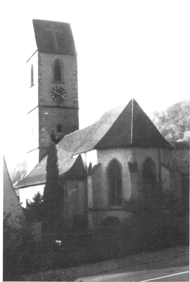
Grenzach-Wyhlen, Ortsteil Grenzach, Pfarrkirche St. Leodegar (Repro aus: J. Helm, Kirchen und Kapellen im Markgräflerland, 1989, S.108).

Burgund) vom Jahre 858 eine villa Sisiacum genannt wird, so bezieht sich diese gar nicht auf unsere Gegend; es ist nicht, wie Bruckner meint, Sissach darunter zu verstehen.»