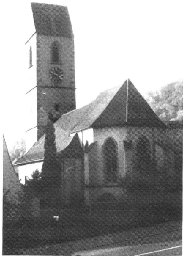
Grenzach-Wyhlen, Ortsteil Grenzach, Pfarrkirche St. Leodegar (Repro aus: J. Helm, Kirchen und Kapellen im Markgräflerland, 1989, S.108).

Burgund) vom Jahre 858 eine villa Sisiacum genannt wird, so bezieht sich diese gar nicht auf unsere Gegend; es ist nicht, wie Bruckner meint, Sissach darunter zu verstehen.»