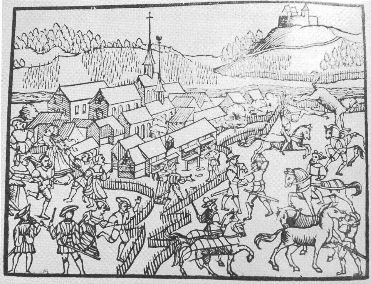
Spätmittelalterliches Dorf mit Etter in Form von Zäunen. (Aus: Rösener Werner: Bauern im Mittelalter. München 1991.)