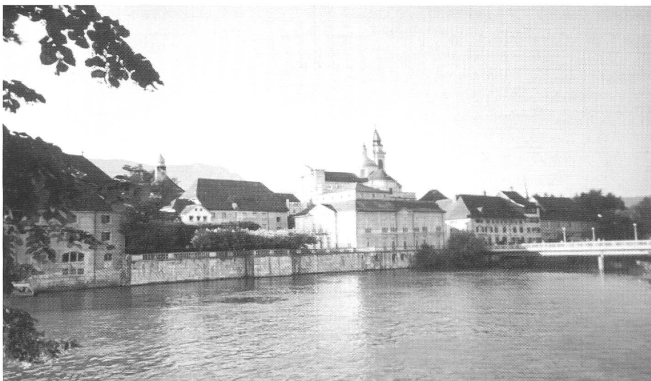
Ansicht von Solothurn. (Photo: D. Wunderlin, 2003).

nehmen. 48 Dem hätten sich die christlichen Soldaten unter den Legionären widersetzt. Daraufhin seien sie mitsamt ihrem Anführer hingerichtet worden. Historisch nachweisen lässt sich lediglich, dass der erste bekannte Bischof Theodor 49 von Octodurum (= Martigny) zu Ehren einer Märtyrergruppe in Agaunum eine Kapelle errichten liess. 50 Eine weitere Schwierigkeit besteht darin, dass es im Umfeld der Thebäerlegende zwei Männer namens Viktor gibt: Derjenige, der in Agaunum das Martyrium erlitt, war ein ortsansässiger Mann, 51 der Legionär