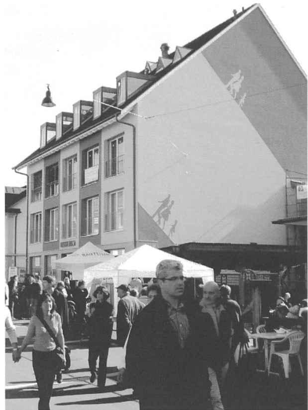
Sissach: Fassade mit Bemalung

Der öffentliche Raum ist ein Tummelfeld von Manifestationen ästhetischer Art. Und über Geschmack lässt sich trefflich