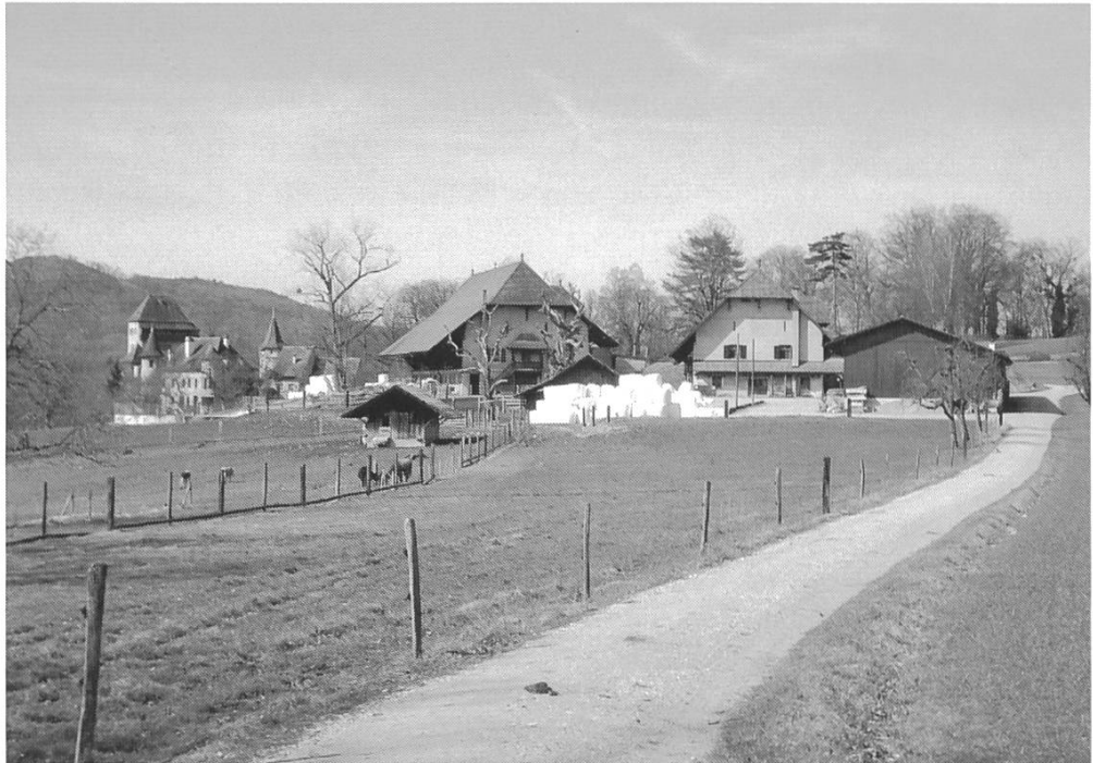
Wildenstein: Ökonomie heute (mit Siloballen)

Eingeladen waren Teams von Planungsbüros, die neben der landwirtschaftlichen Aufgabenstellung explizit den Auftrag hatten, eine gestalterisch optimale Lösung in diesem komplexen Kontext von denkmalgeschützten historischen Gebäuden, historischer Kulturlandschaft, Naturschutzgebiet und Topographie zu finden. Ausserdem sollte ein Flachsilo die Umgebung von den störenden Siloballen entlasten 7 . Die DHK, die bereits den Wunsch nach der Ausschreibung eines Wettbewerbs ausgedrückt hatte 8 , begrüßte den Entscheid, auch funktionale landwirtschaftliche Gebäude in exponierten Situationen als gestalterische Aufgabe ernst zu nehmen, und nahm das Angebot an, neben der Denkmalpflege in der Jury vertreten zu sein.