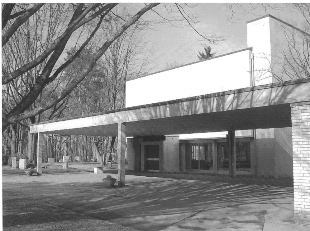
Pratteln: Friedhof Blözen