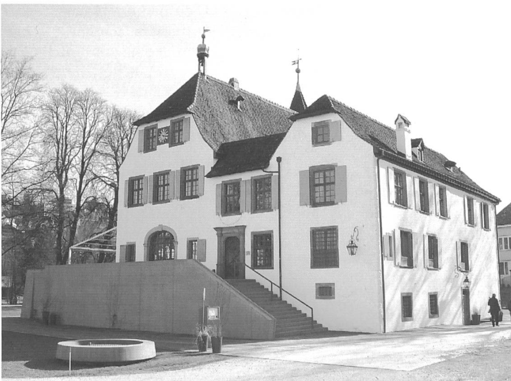
Binniger Schloss, heutiger Zustand.

Die DHK wurde vom Gemeinderat um eine Stellungnahme gebeten: Einerseits war von einer privaten Gruppe die Idee einer frontalen Freitreppe als Alternativprojekt eingereicht worden. Diese Idee wurde später als Initiative auf Gemeindeebene lanciert; wir werden also auf das Thema zurückkommen. Andererseits gab es verschiedene Vorschläge, wie die Mauer niedriger gemacht und die Brüstung durch ein Staketengeländer oder eine Glasbrüstung ersetzt werden könnte.