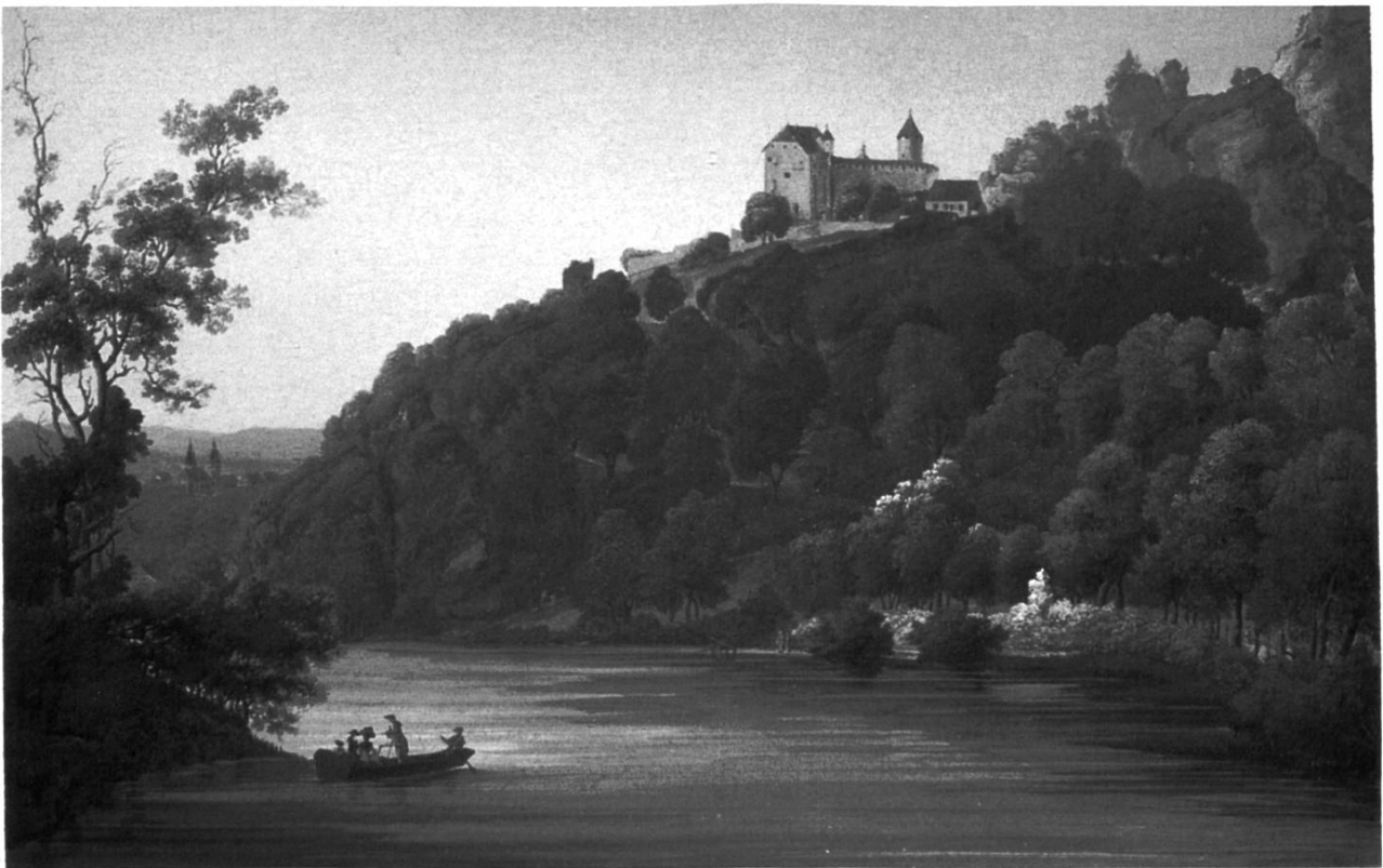
Johann Baptist Stuntz (Zeichnung und Kolorierung) / Johann Joseph Hartmann (Radierung): II de Vue de la Solitude Romantique près d'Arlesheim dans l'Evêché de Bâle. Radierung gouachiert. 27,5 x 42,5 cm. (Privatbesitz).

Den Kontakt zu Bertuch und Zurlauben konnten die Gründer der Eremitage über den Basler Kupferstecher und Kunsthändler Christian von Mechel herstellen, der über ein ausgezeichnetes Netz internationaler Kontakte verfügte. Mechel sorgte aber nicht nur für die Verbreitung