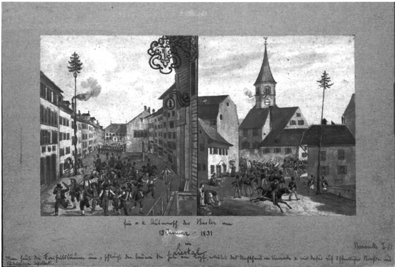
Ein- und Ausmarsch der Basler in Liestal, 16. Januar 1831; unsigniert; Museum.BL Liestal

Dem Statthalter und den regierungstreuen Kräften in und um Diepflingen ging es mit der Entfernung des Freiheitsbaumes und seiner Ausstaffierung, der Fahne und der Schrifttafel, darum, ihre Macht unter Beweis zu stellen und die Zugehörigkeit der Gemeinde zu Basel zu unterstreichen. Die Aufständischen waren zwar derselben Zugehörigkeitslogik verhaftet, wollten aber im Gegenteil dafür sorgen, dass in Diepflingen ein Freiheitsbaum stand, der anzeigte, dass die Dorfbevölkerung die Revolution unterstützte. Der Freiheitsbaum war zwar nicht die Ursache der Machtverhältnisse im Dorf, konnte aber darüber bestimmen, ob das Dorf nun mit «regierungstreu» oder «revolutionär» bezeichnet wurde.