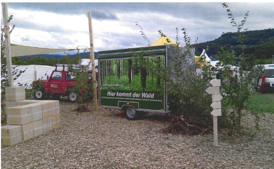
Abb. 05-11: Waldmobil des Försterverbandes, des Waldwirtschaftsverbandes und des Amtes für Wald beider Basel

Paul Ehrsans Wunsch ist in Bezug auf Kriegsereignisse in Erfüllung gegangen. Trotzdem stehen wir heute, 50 Jahre später, vor einer ähnlichen Situation wie 1962. Nicht Kriege bestimmten und bestimmen unsere alltägliche Situation im Wald und in der Waldbewirtschaftung, sondern wirtschaftliche, gesellschaftliche und klimatische Veränderungen. So schliesse ich meinen Bericht im Sinne von Paul Ehrsam: « Mögen die nächsten 50 Jahre in einer späteren Jubiläumsrückschau unbelastet von klimatischen, wirtschaftlichen und gesellschaftlichen Verwerfungen registriert werden. »