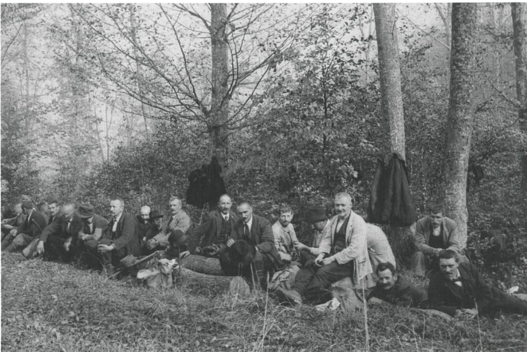
Abb. 05-2: 1927 Forstkurs im Talhölzli in Pratteln, Kantonsob- erförster Friedrich Stoeckle (7. v. rechts) mit Förstern

Zu vielen Diskussionen führte schon im ersten Verbandsjahr ( 1912 ) der Umstand, dass die Bundesbeiträge an die Besoldung des unteren Forstpersonales in die Gemeindeförster flossen und nicht an die Gemeindeförster ausbezahlt wurden. Auch wurden Vorstösse unternommen, diese Grundbesoldung des unteren Forstpersonales von damals Fr. 2.50 auf Fr. 3.– pro