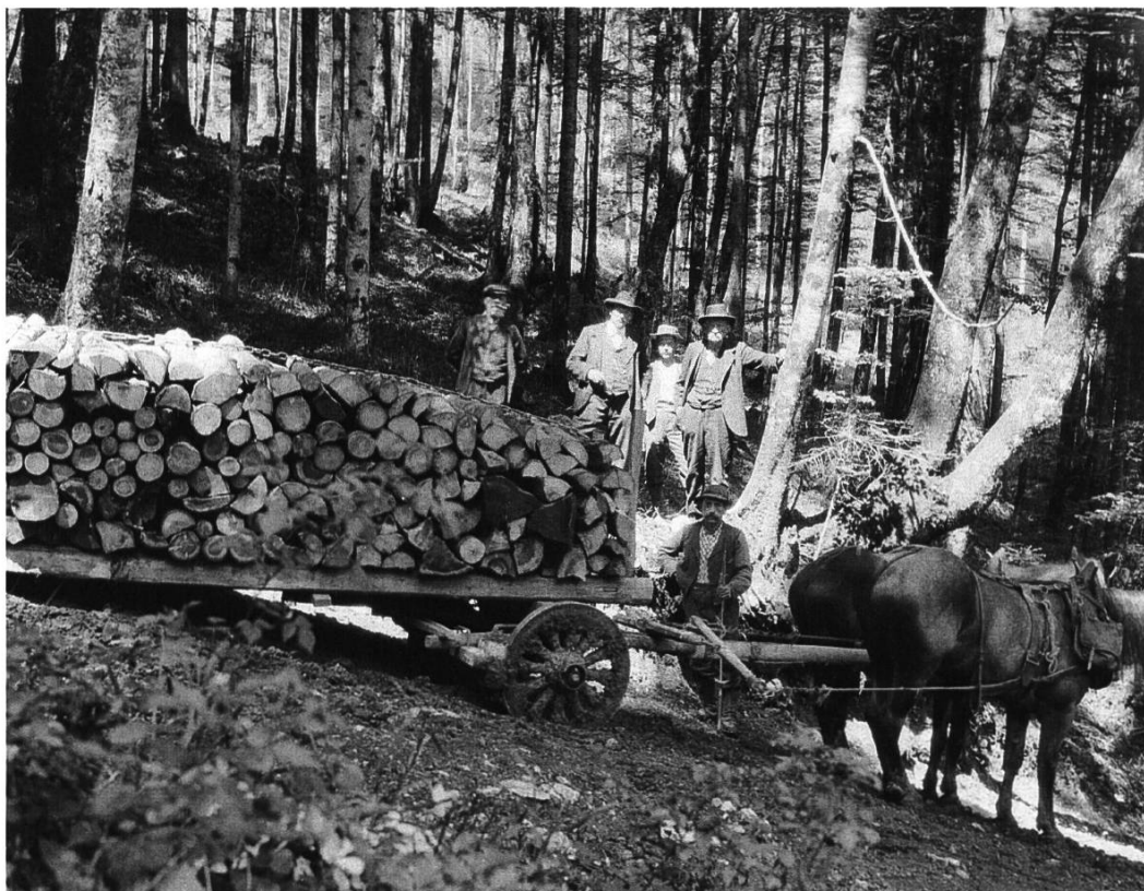
Abb. 05-5: 1925 (ca.) Brennholz- abfuhr

An der JV 1920 war das Haupttraktandum die «Kollektivversicherung des Gemeindeforstpersonals». In der Annahme,