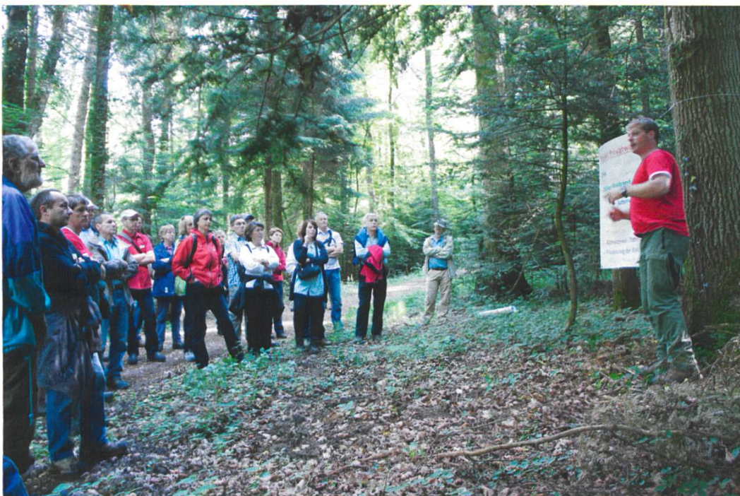
Abb. 05-8: 2011, Wald- gang mit den Behörden des Forstreviers Angenstein in Therwil