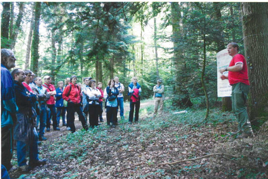
Abb. 05-8: 2011, Waldgang mit den Behörden des Forstreviers Angenstein in Therwil