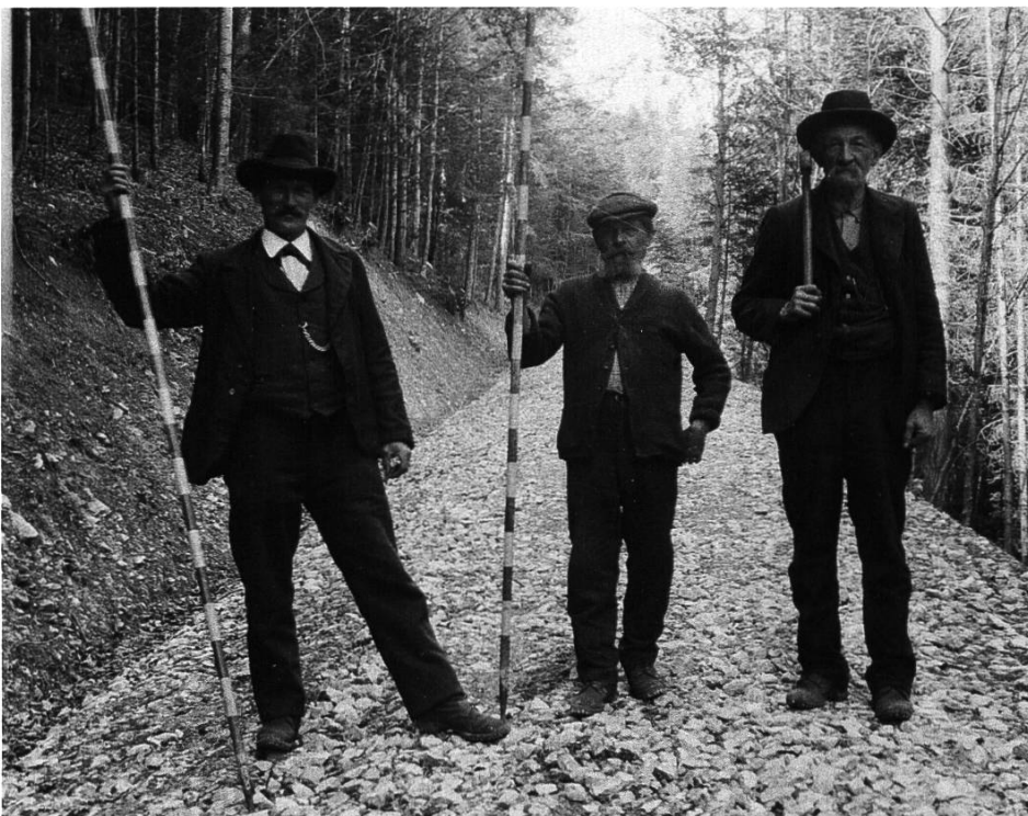
Abb. 05-3: Wegebau ca. 1927

1918 erteilte der Kantonsoberförster die Weisung, es sei bei Arbeiten im Privatwald ein Stundenlohn von Fr. 2.– zu verlangen. 1922 wurde festgestellt, dass das Traktandum der Hektarentschädigungen der Privatwaldbesitzer an die Gemeindeförster an keiner Vorstandssitzung und Verbandsversammlung fehlte. Es wurde darüber geklagt, dass diese Beiträge nur schwer einzubringen seien.