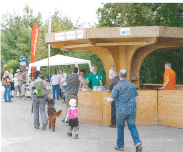
2011 Waldtage in Aesch, Infostand