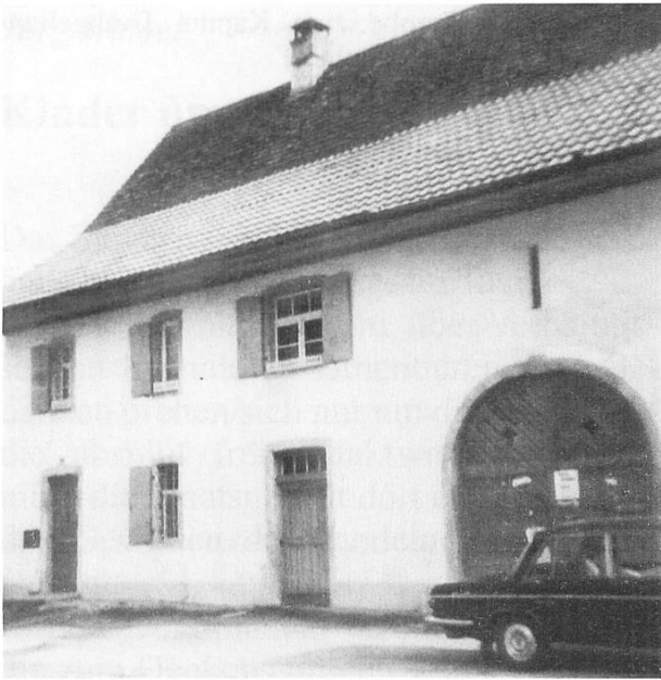
Abb 3: Im Estrich dieses 1974 abgebrochenen Hauses «Vorstatt 59» in Seltisberg der Geschwister Spinnler S' Murers wurde dieses Hausbuch der Familie Schäfer gut 100 Jahre aufbewahrt, ehe es vor rund 60 Jahren nach Ziefen kam.

und von Joh. Ludwig Brandmüller in Basel gedruckt und verlegt. Das Buch weist 310 Seiten im Format 18 x 21 cm auf und ist mit einem soliden Einband ausgestattet. Im Titelbild ist ein Engel dargestellt mit einem Schriftband: «Suche in der Schrift».