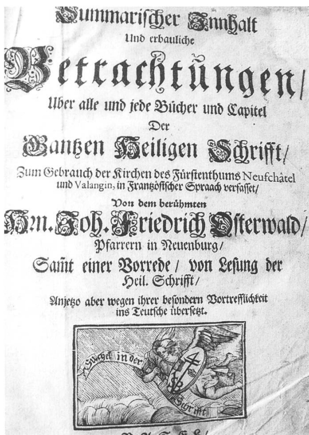
Abb. 2: Titelbild der deutschen Übersetzung der im ehemaligen preussischen Fürstentum Neuenburg erschienenen französischen Originalausgabe.

lung General Henri Dufour zum Oberbefehlshaber und Bundesrat Frey Hérosé zum Generalstabschef. Die Truppen marschierten an die Nordfront an den Rhein zur Grenzbesetzung gegen Deutschland. Die süddeutschen Staaten hatten bereits den Durchmarsch der preussischen Truppen durch ihr Gebiet bewilligt. Dank der Entschlossenheit der Schweizer und Vermittlung durch den französischen Kaiser Napoleon III. (welcher bekanntlich seine Jugendjahre auf Schloss Arenenberg (Kanton TG) am Bodensee verbrachte) konnte eine militärische Konfrontation verhindert werden. So kam am 26. Mai 1857 die endgültige Einigung zustande. Preussen verzichtete auf Neuenburg und Valangin gegen eine Summe von einer Million Franken. Dem Preussenkönig Friedrich Wilhelm IV. blieb der Titel eines Fürsten von Neuenburg. Da er aber zwei Millionen Franken Entschädigung verlangt habe, wies er die eine allein zu-