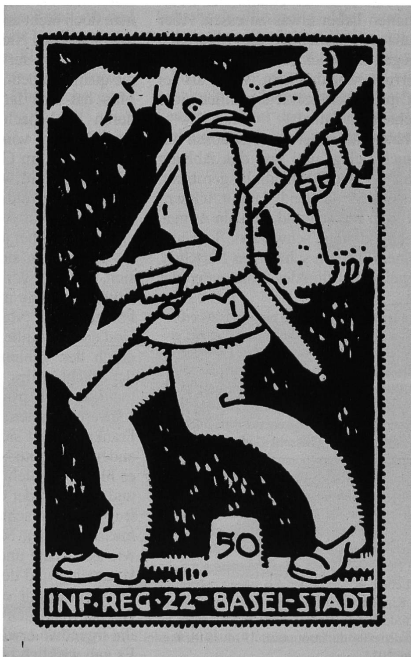
Abb. 9: Bei Kilometer 50. Feldpostkarte des Basler Infanterie-Regiments 22. Um 1916.