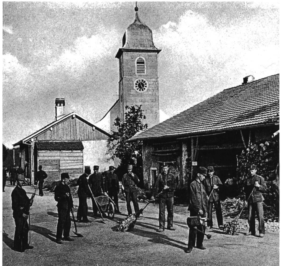
Abb. 2: Erste Aufgabe nach dem Einmarsch in Pleigne: die Strassenreinigung.