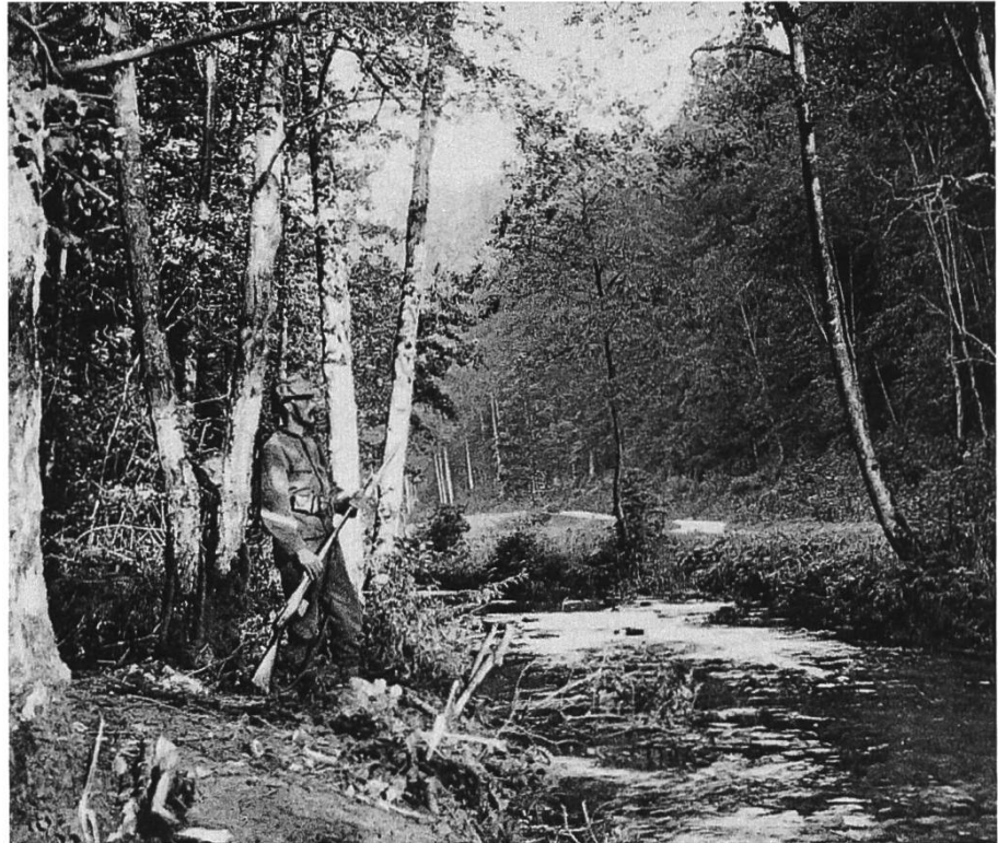
Abb. 7: Einsame Wacht an der Lützel.

unsrer Grenzwacht. An einem etwas kühlen, hellen Augustabend, der auf einige regenschwere Tage folgte, beziehe ich mit 8 Mann den Unteroffiziersposten 3 in einem Waldhang über der Lützel, zirka 500 m von der deutschen Grenze entfernt. Etwa eine Viertelstunde hinter dieser vordersten Postenlinie hauste das Gros, der «Gewalthaufe» der Kompagnie, in einem fast schlossähnlichen Landgute. 11 Die massive Anlage der Gebäude, seine meterdicken Mauern, auf der Nordseite nur durch schmale Schiesscharten unterbrochen, lassen auf die Erbauung in früheren kriegerischen Zeiten schliessen. Zwei Kilometer weiter rückwärts hinter einem starkbefestigten Höhenzug liegen zwei Bataillone unseres Regiments in Garnison P. 12