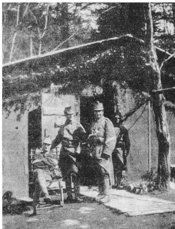
Abb. 4: Schauplatz des «Grenzzwischenfalls»: der Unteroffiziersposten Säge Ost im Lützeltal.

Eines Tages kommen der Herr Bataillons- kommandant und sein Schatten, der Ad- jutant, den Posten besichtigen. Es entgeht ihren scharfen Augen aber auch gar nichts,