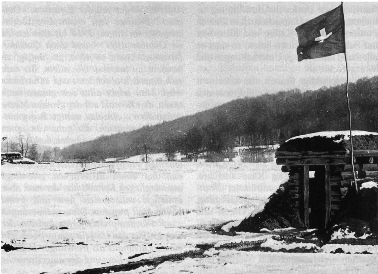
Abb. 8: Splittersichere Unterstände im Largzipfel. Links des kleinen Unterstandes hinter dem Ufergehölz erkennbar sind die Ruinen der Largmühle.