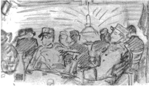
Abb. 6: Die Soldatenstube von Pleigne. Zeichnung von J. J. Lüscher, 1915.

Einen etwas andern Charakter hatte ein weiterer Zwischenfall. Einige deutsche Soldaten ödeten unseren Posten an, welcher sich das nicht ohne weiteres gefallen lassen wollte und deshalb die Gewehre schussbereit macht, worauf die Deutschen ihre Revolver hervorzogen. Glücklicherweise blieb es bei der gegenseitigen Bedrohung. Die Deutschen riefen einige Schimpfwörter über die Grenze und entfernten sich, womit dieser deutschschweizerische Konflikt sein friedliches Ende gefunden hatte. 7