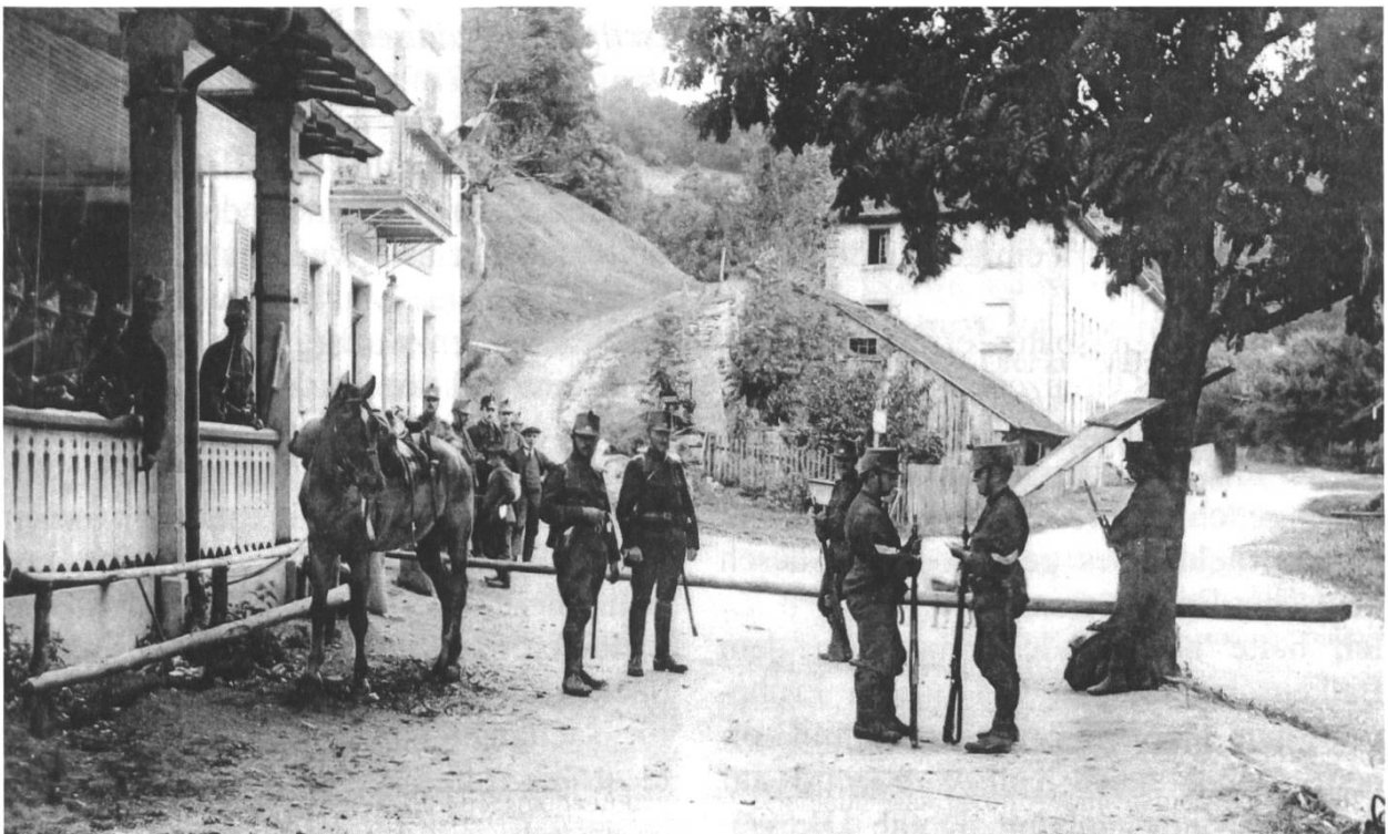
Abb. 5: Ein interessanter Grenzposten war auch beim Hotel in Lucelle / Lützel. Hier verkehrten zu gewissen Zeiten deutsche und Schweizer Offiziere in der gleichen Gaststätte.

Kaum sitze ich am Frühstück, geht es draussen wieder los: «Wär het denn dä Bleedsinn g'macht? Dien Sie dä Balgge