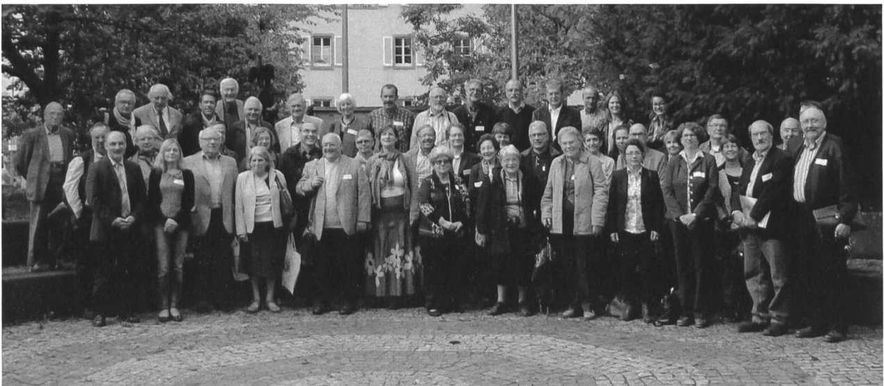
Teilnehmer beim Treffen des Netzwerks Geschichtsvereine am Oberrhein im Dreiländermuseum Lörrach.

Dem Netzwerk ist es in den vergangenen zwei Jahren gelungen, eine Adressdatenbank mit mehreren hundert Geschichtsvereinen am Oberrhein aufzubauen und eine informative Website zu gestalten. Ein regelmäßiger Newsletter informiert über grenzüberschreitend interessante Aktivitäten der Vereine und wichtige Publikationen. Zu den Aktivitäten des Netzwerks gehörten nach der Gründungsversammlung 2012 in Lucelle im Elsass außerdem das grenzüberschreitende Geschichtskolloquium 2013 in Straßburg sowie zahlreiche Publikationen.