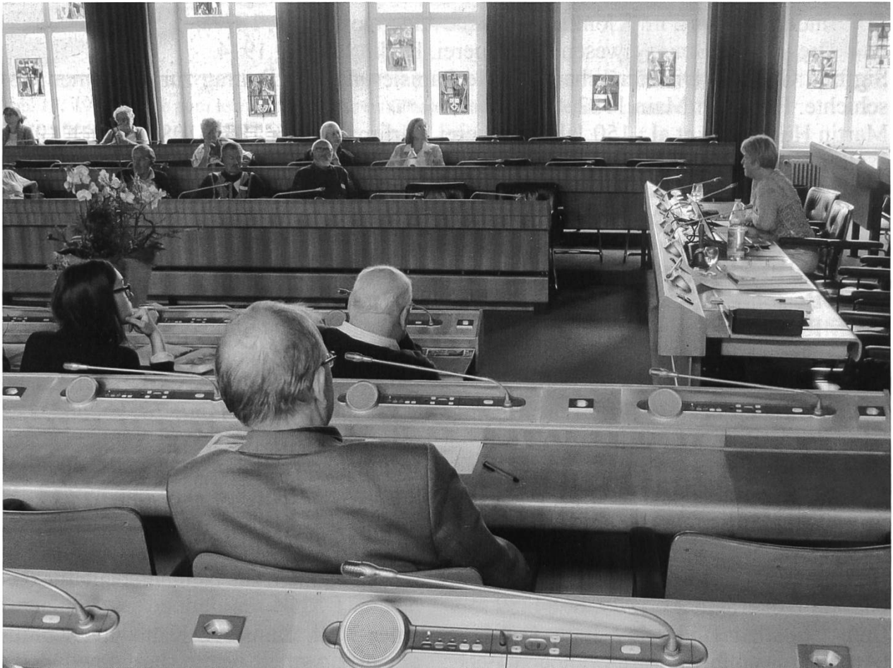
Abb. 1: Aus dem ganzen Oberrheingebiet versammelten sich Geschichtsinteressierte im Liestaler Landratsaal.

Am 24. Oktober 2015 fand in Liestal das dritte Grenzüberschreitende Geschichtskolloquium des trinationalen Netzwerks Geschichte statt. Dabei waren alte und neue Grenzen und ihre Bedeutung wiederholt ein Thema.