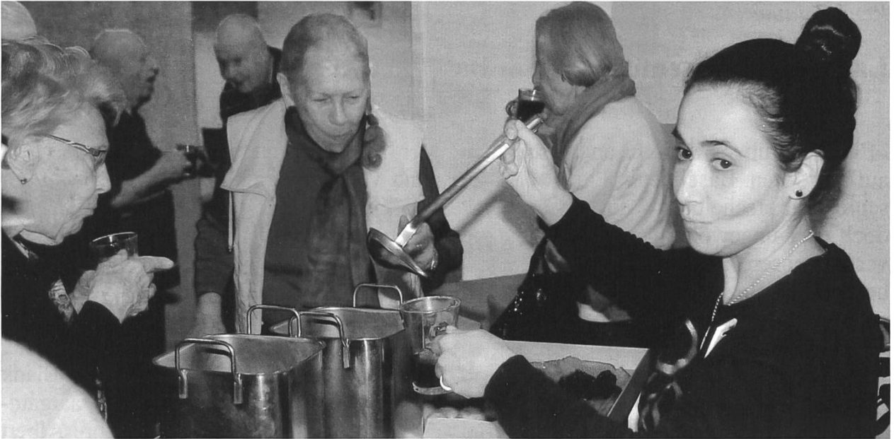
Verschlaufpause bei Tee und Dörrobst.