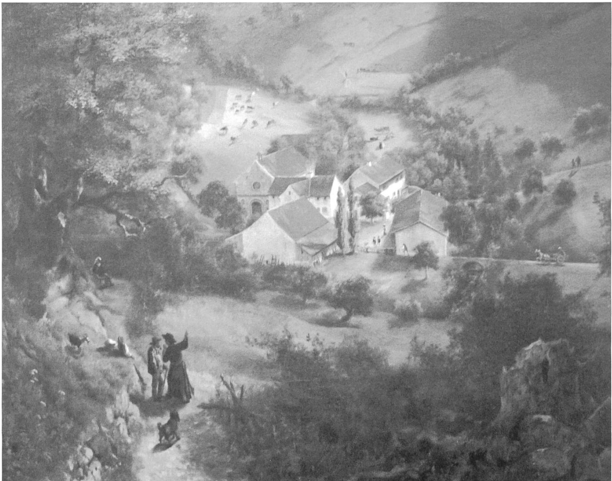
Der Klosterkomplex des Schönthals, von Arnold Jenny 1877 in einem Ölbild festgehalten. (Denkmalpflege BL)

tohaltstelle Dorf – oder auf dem Wanderweg zur Haltstelle Passhöhe. Das Dorf hat schon bessere Zeiten gesehen. Von den vielen Wirtschaften entlang der Hauensteinstrasse sind noch wenige übrig geblieben. Was in der Mitte des 19. Jahrhunderts als Luftkurort mit europaweiter Ausstrahlung begann, in den 1890er-Jahren seine Hochblüte erlebte und mit dem Ersten Weltkrieg einen ersten Niedergang hinnehmen musste, wurde spätestens mit der Eröffnung der Autobahn durch den Belchentunnel ins motorisierte Abseits gestellt. Viele zum Verkauf angeschriebene Häuser belegen, dass hier mehr ab- als zugewandert wird. Und der letzte Hotelbau aus der Blütezeit des Luftkurorts, das Kurhaus Erica, ist nun auch geschlossen. In der Mitte des 19. Jahrhunderts besass der Luftkurort sogar einen Kuresel, der es den älteren und des Gehens nicht gewohnten Herrschaften ermöglichte, auf den umliegenden Hügeln an der guten Luft die Aussicht zu geniessen.