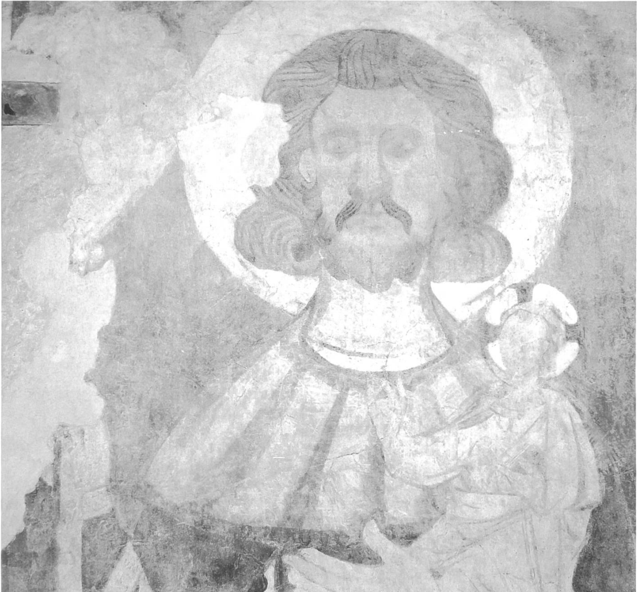
Christophorus-Darstellung aus dem 14. Jahrhundert.

land bis zu den Alpen. Hier ändert sich auch die Vegetation vom feuchten Milieu im Norden zu trockenen Standorten auf der der Sonne zugewandten Seite.