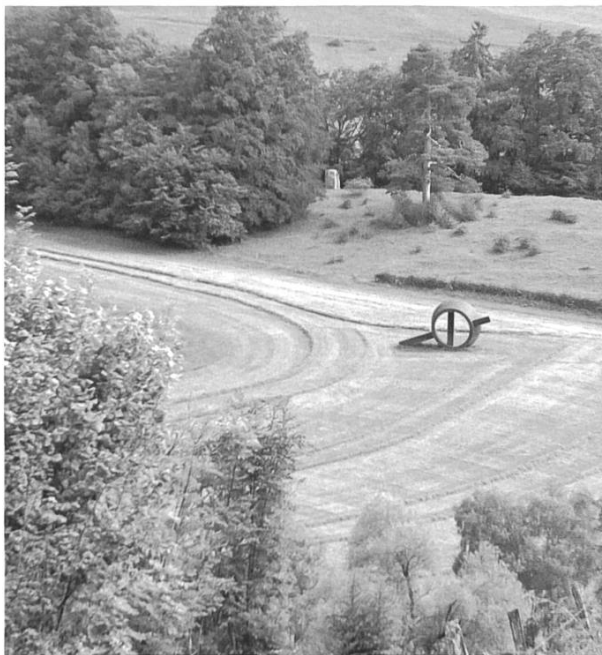
Die Skulptur Soglio von Nigel Hall und die Bewirtschaftung der Umgebung ergänzen sich hier auf eine eindruckliche Weise.

Nach dem Besuch des Spitteler-Denkmals und der Kirche geht es in Richtung Dielenberg. Beachtenswert sind die weitgehend in ihrer ursprünglichen Form erhaltenen Bauernhäuser