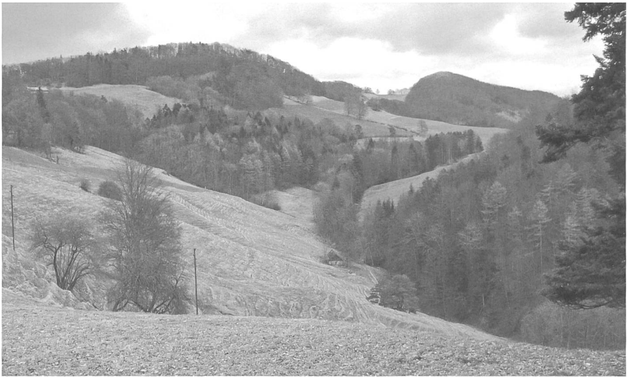
Der Name ist hier Programm: Schönthal.

Aufgabe des Klosters während der Reformation, Schönthaler Geistliche sonn- und feiertags den Weg nach Bennwil resp. Titterten unter die Füße nehmen mussten.