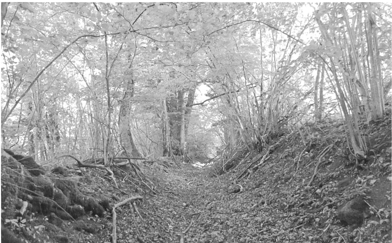
Der Hohlweg durch die Flur Ried.

Als 1189 der Froburgische Graf Hermann II. einem Enkel des Stifters Graf Ludwig die Patronatsrechte der Kirchen von Bennwil und Titterten übertrug, war damit auch die seelsorgerische Betreuung der Gemeinden verbunden. Es muss somit davon ausgegangen werden, dass vom 12. Jahrhundert an, mit Unterbrüchen, als das Haus ein reines Frauenkloster war, bis zur endgültigen