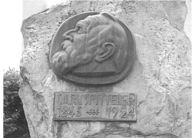
Die Kirche und das Spitteler-Denkmal dominieren den Dorfplatz Bennwils.

der dem heiligen Martin geweihten Kirche wird die Taufschale aus dem Kloster Schönthal aufbewahrt. Nach deren Bild wurde 1945 das Gemeindewappen gestaltet.