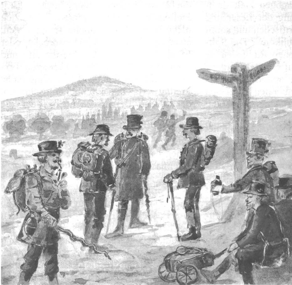
Abb. 2: Oftmals reisten Gesellen miteinander. Das wenige Gepäck wurde im Felleisen – quasi einem Rucksack – transportiert. Der Erzähler von Gotthelfs Roman spottet über die neue Mode, das Felleisen auf ein Wägelchen zu packen: «Aber das Ding ging nicht ohne Mühe, es mußte halt gestoßen oder gezogen sein und wenn man es genau betrachtete, so war ein solch Ziehen oder Stoßen vielleicht noch mühseliger als das Tragen, jedenfalls stund das Tragen dem Burschen viel besser an.» (HKG A.6.1, 2012, S. 23,26–29.)

in der fachlichen Qualifizierung und sittlichen Bildung Jacobs findet. Insgesamt schildert der Roman also auch die Entwicklung eines etwas naiven und zugleich hochmütigen Jünglings zu einem in allen Lebensbereichen gereiften Handwerker, der nun auch die Verantwortung für einen meisterlichen Haushalt übernehmen kann. Gotthelf skizziert eine alineare sittlich-christliche Reifung der Hauptfigur, die von Anfang an über Schwächen und Tugenden gleichsam verfügt. Dahinter steht stark vereinfacht ausgedrückt die Vorstellung, dass Menschen «tierische» und «göttliche» Anteile hätten, die sich je nach wirkenden Kräften durchsetzen würden. 30 Optimistisch gewendet ist damit immer auch schon die Fähigkeit zur sittlich-religiösen Besserung («Vervollkommnung») des Menschen in seiner Natur angelegt.