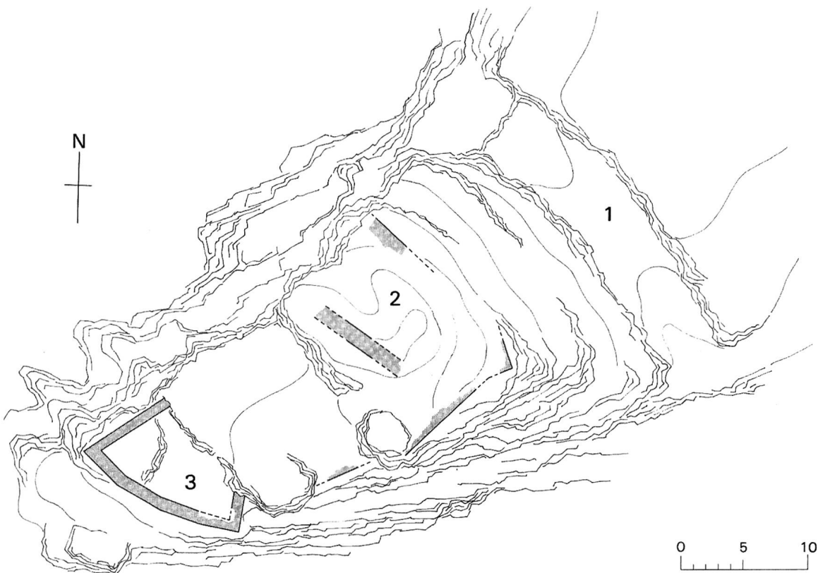
Chastè bei Sils i. E., Grundriss. 1 Graben, 2 Stelle des Hauptbaues, 3 Südwesttrakt.

nicht alle Burgen, die in der schriftlichen Überlieferung auftauchen, mit Sicherheit zu identifizieren, und umgekehrt schweigen sich über manche Burgstellen, die im Gelände deutlich sichtbar sind, die erhaltenen Schriftquellen aus. Für einige solche Anlagen überliefern erst die Bündner Chronisten des 16./17. Jahrhunderts mehr oder weniger glaubwürdige Namen. Wie schwierig die Zuweisung – und damit auch die Datierung – urkundlich nicht bezeugter Burgstellen ist, zeigt das Beispiel der beiden Burgplätze Chastè und Castlatsch im Oberengadin: In den sog. Gamertingerurkunden von 1137/39, in denen die Gebrüder Ulrich und Konrad von Gamertingen ihren gesamten Besitz im Oberengadin der Kirche Chur vermachen, werden zwar Personen, Alpen, Wiesen und Ortschaften aufgezählt, aber keine Burgen. Nach der Aufrichtung der Landeshoheit durch die Bischöfe, die als Verwaltungszentrum die Feste Guardaval bei Madulein erbauen liessen, dürften – ausser Wohntürmen in den Dörfern – im Oberengadin keine Burgen mehr gebaut worden sein. Wie sind demnach Chastè und Castlatsch einzuordnen? Von archäologischen Untersuchungen könnte wenigstens eine Datierung der beiden rätselhaften Anlagen erwartet werden, die man einstweilen eher in die Frühzeit des Burgenbaues, also in die Zeit vor den Gamertingern, einordnen möchte. 8