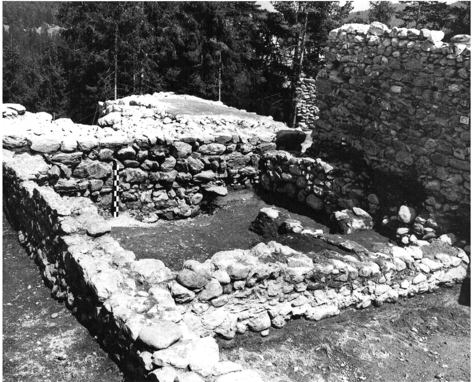
Schiedberg während der Grabungen 1968. Im Vordergrund Fundamente des Tellohauses (Periode 5), hinten links Reste des Hauptturmes (Periode 8).