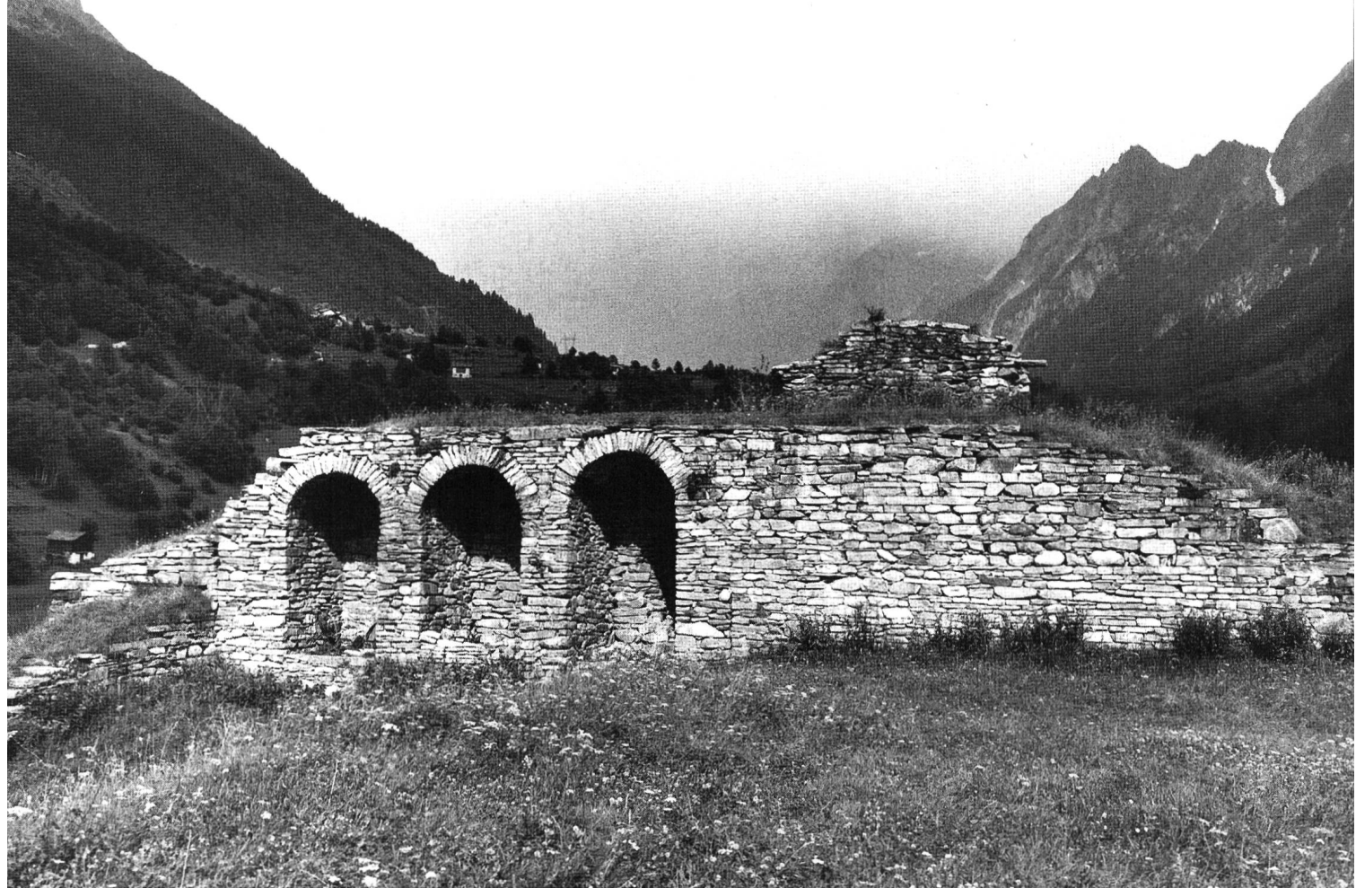
Castelmur, Wehrmauer auf der untersten Felsstufe.

( homines de Castro Muro , 1186). Im Namen der bischöflichen, auf der Burg sitzenden Ministerialenfamilie, die 1190 mit Albertus de Castello Muro erstmals bezeugt ist, lebt aber das alte Wort castellum weiter.