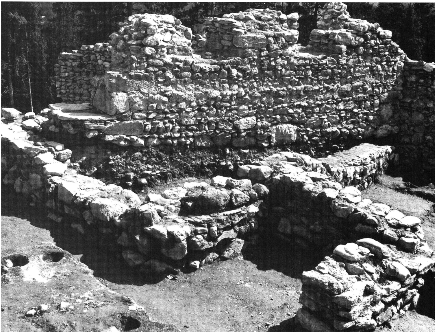
Schiedberg während der Grabungen 1968. Im Vordergrund römische und frühmittelalterliche Fundamente (Perioden 2 bis 4), im Hintergrund Mauer des Wohnbaues aus dem 13. Jahrhundert (Periode 9).