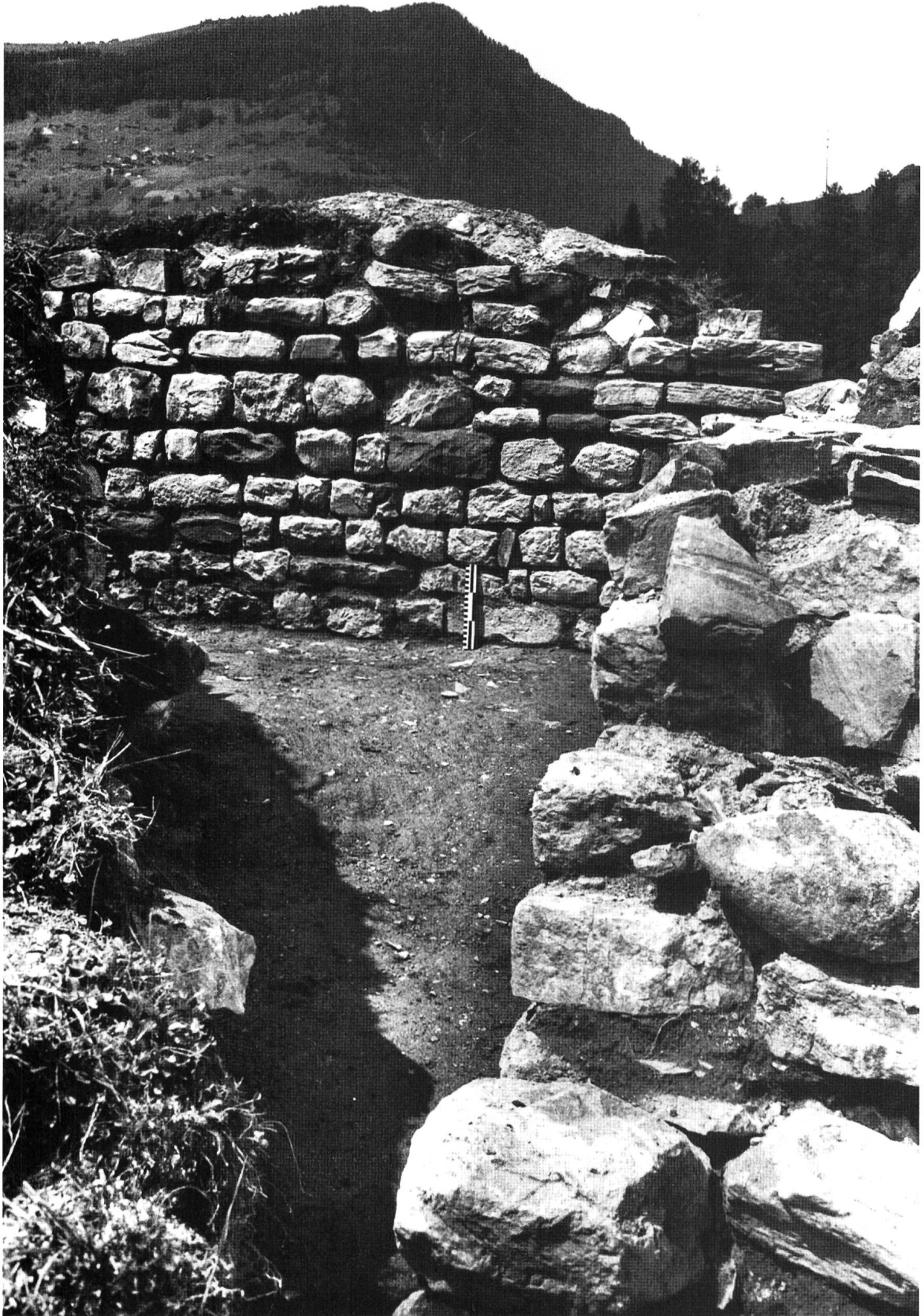
Nivagl, Reste des zentralen Steinbaues während der Grabungen 1980.