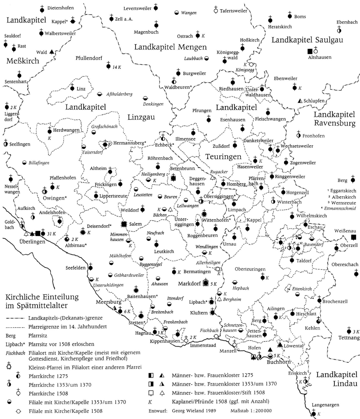
Die Pfarreien Seefelden und Bermatingen innerhalb der kirchlichen Einteilung des Linzgaus im Spätmittelalter.

Adelgot von Chur mit Lehen im nahen Oberschwaben belehnt waren 37 . Nur am Rande, weil nicht unmittelbar in das Thema churrätisch-bodenseischer Beziehungen hineingehörend, sei darauf verwiesen, dass die Forschung auf verwandtschaftliche Bindungen mit den Grafen von Nellenburg auch die Maienfelder Besitzungen und Rechte der in Innerschwaben, im Vorfeld der Schwäbischen Alb «beheimateten» Grafen von Achalm zurückgeführt hat 38 . Einerseits in einer Verwandtschaft mit den Grafen von Bregenz und andererseits in einer solchen mit den Grafen von Achalm hat man auch den Grund dafür sehen wollen, weshalb die wiederum in einem Tal der Schwäbischen Alb «beheimateten» Grafen von Gammertingen im frühen 12. Jahrhundert im Oberengadin begütert waren 39 . Anders steht es nebenbei