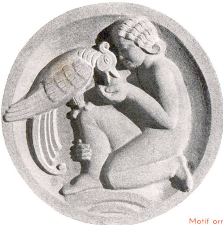
Motif ornemental sculpté dans un simili-calcaire

Pour tous autres renseignements s'adresser au SERVICE DE RECHERCHES ET CONSEILS TECHNIQUES DE LA E. G. PORTLAND HAUSEN près BRUGG.