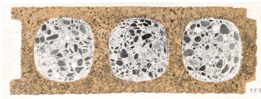
Coupe à travers un corps creux en liège, rempli de béton (18×50 cm)