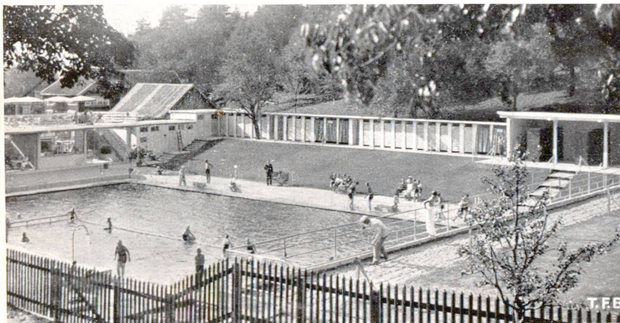
Fig. 3 Piscine de Walzenhausen (Appenzell Rh. ex.). Planchers, parois extérieures et cloisons intermédiaires en ciment-métal déployé. Eléments porteurs et bassin en béton armé. Projet et direction des travaux: Bureau d'ingénieur Keller, Brugg. Exécution: Bruderer & Calderara, Teufen-Walzenhausen.

Enduits: pour façades en maçonnerie avec charpente en bois, plafonds et voûtes suspendus, réservoirs d'eau, etc.