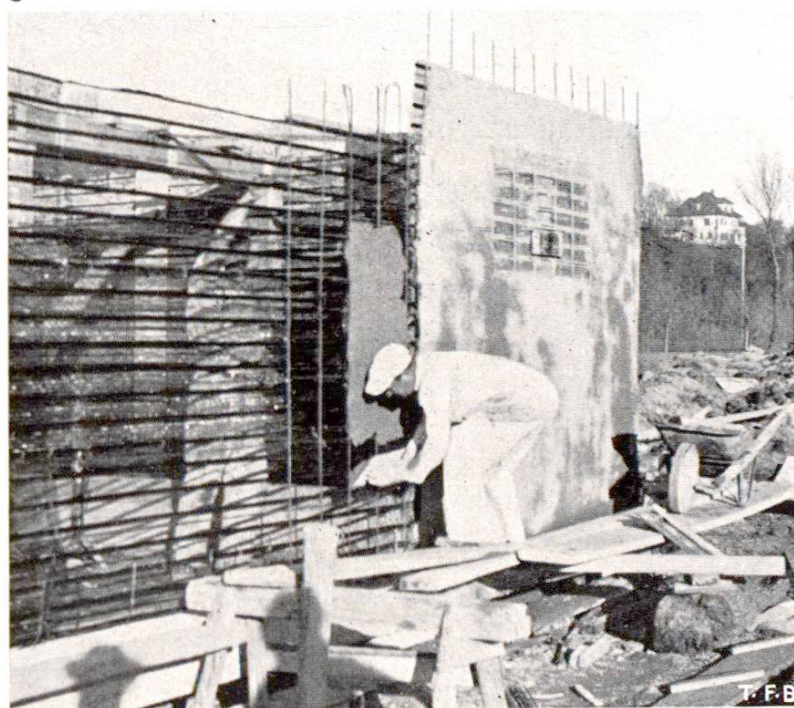
Fig. 1 Exécution (piscine de Möriken-Wildegg)

L'avantage prédominant du métal déployé consiste dans le fait qu'il remplit à lui seul trois fonctions importantes: base d'application du mortier, armature et coffrage. Le métal déployé se fabrique en soumettant de minces tôles de fer de 0,4 à 0,6 mm d'épaisseur, aux trois opérations suivantes: fendage, étirage et nervurage. Il est vendu dans le commerce en panneaux de 0,6 à 0,7 m de largeur et de 2,5 à 3,6 m de longueur.