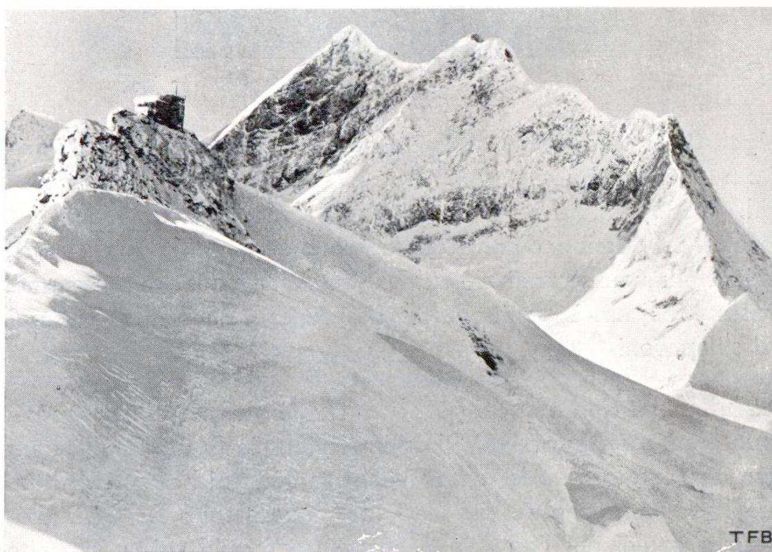
Fig. 3 Observatoire météorologique du Jungfrauoch (3570 m)

6 Pour terminer rappelons que tous les éléments porteurs de l'audacieuse construction que constitue le nouvel Observatoire météorologique du Jungfrauoch (fig. 3) ainsi que le revêtement du puits d'accès, haut de 111 m, ont été construits en béton armé. Par suite des conditions atmosphériques extrêmement défavorables qui règnent sur une arête de rocher à l'altitude de 3570 m, l'entreprise a dû prendre des mesures de précautions spéciales pour protéger le béton et la maçonnerie des atteintes du gel. Comme on peut s'en rendre compte sur la fig. 1, l'ouvrage entier était enfermé dans une halle en bois. Au moyen d'appareils spéciaux à air chaud on pouvait chauffer la halle de protection et l'intérieur du puits si bien qu'on a pu bétonner et maçonner sans danger malgré les baisses régulières de température et des gelées occasionnelles.