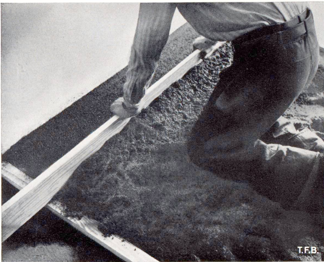
Fig. 2 Le mortier est réglé puis comprimé au moyen d'une latte

parfaitement dure, ou si cette surface est trop lisse, il faut la repiquer. Il est toujours préférable de travailler « frais sur frais », c'est-à-dire de poser la chape directement sur le béton frais, avant qu'il ait fait prise. Le mortier fait alors corps avec le béton et ne risque pas de s'en décoller.