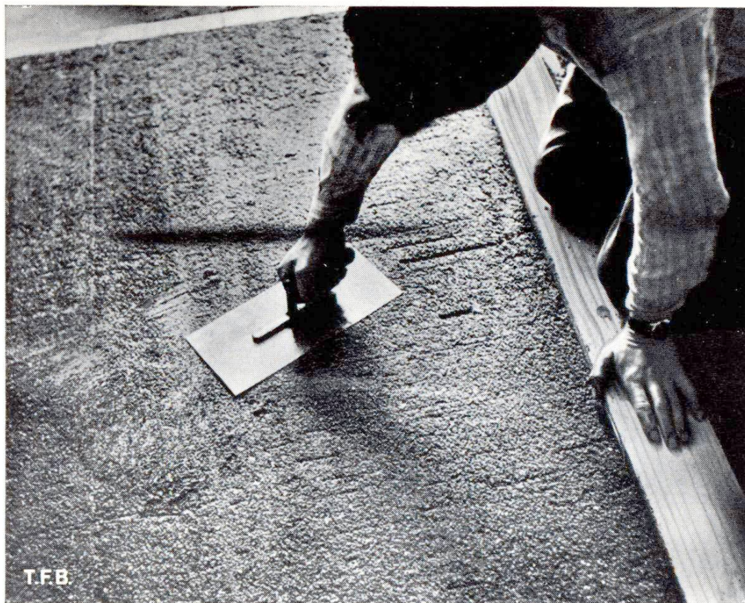
Fig. 4 Lissage de la chape au moyen d'une taloche spéciale