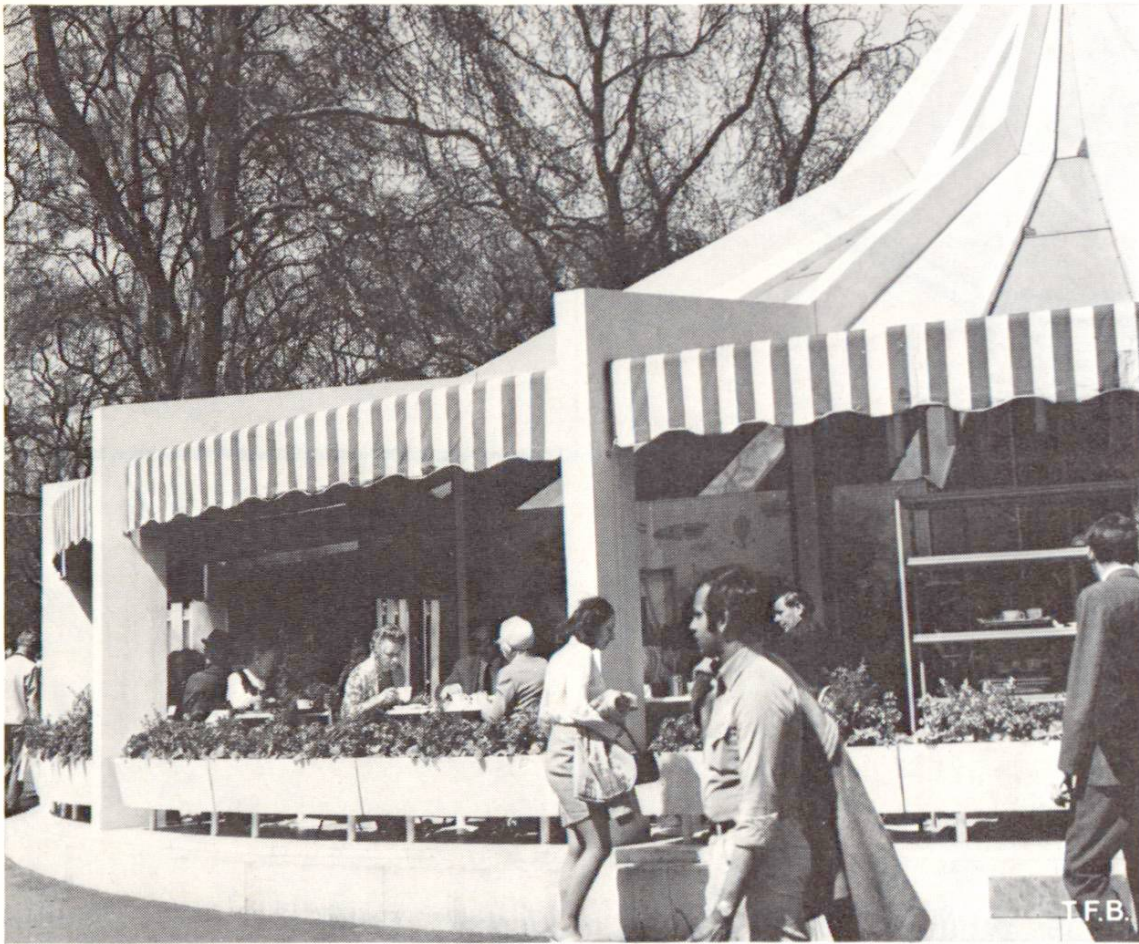
Fig. 3 Le toit circulaire est divisé en 14 segments. Les éléments en béton de ciment blanc ont une surface lissée. Entre les segments de béton se trouvent des plaques de verre.