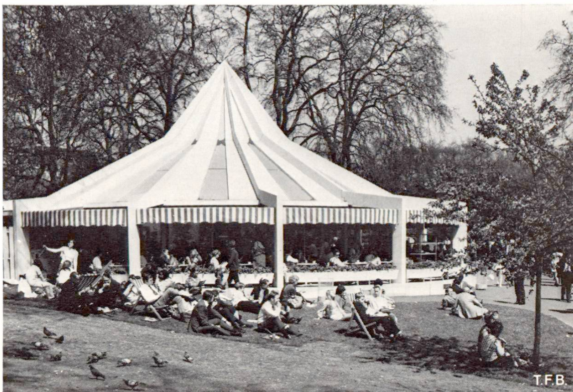
Fig. 2 Il y a 58 places assises sur la terrasse côté sud et 72 à l'intérieur. Dans l'autre moitié du pavillon circulaire se trouvent la cuisine et les toilettes.

S'agissant d'un parc londonien, il n'est pas étonnant qu'on ait choisi une solution un peu révolutionnaire. C'est une image du mode de vie de ce pays où l'on est libre et tolérant. Des formes