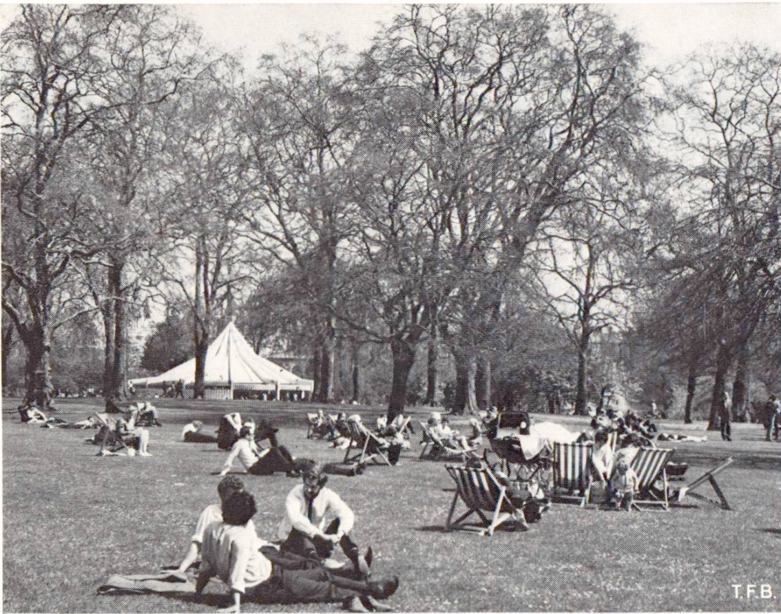
Fig. 1 Les grands parcs londoniens sont des lieux de détente où les visiteurs se sentent en liberté.