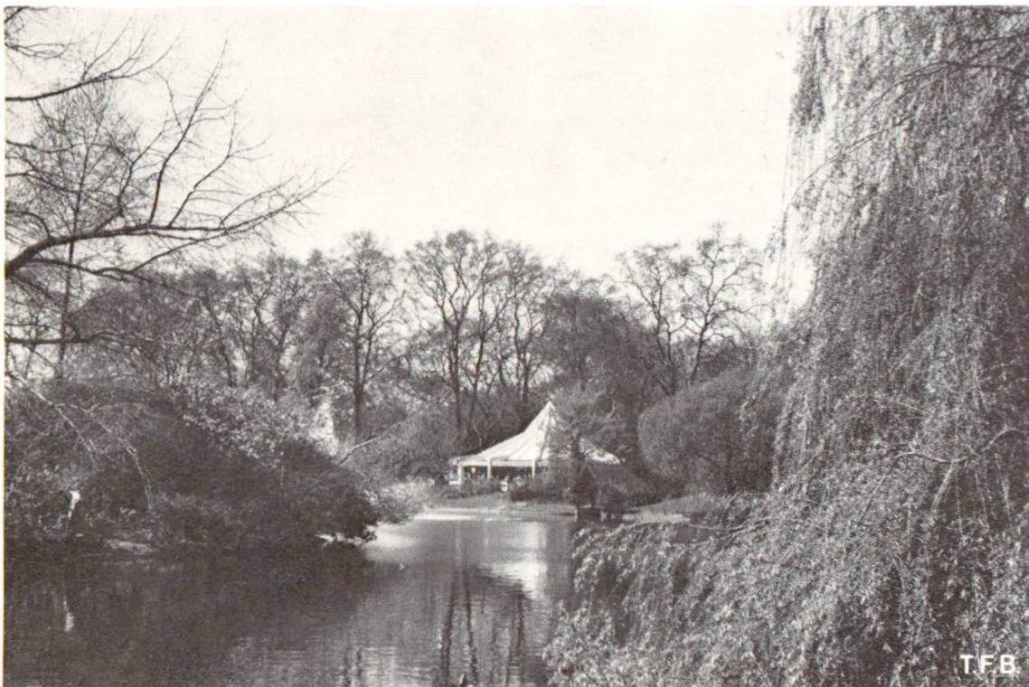
Fig. 4 Il est à peine croyable que cette photo ait été prise au centre de l'immense capitale, à environ 500 m de Piccadilly Circus ou de Trafalgar Square.