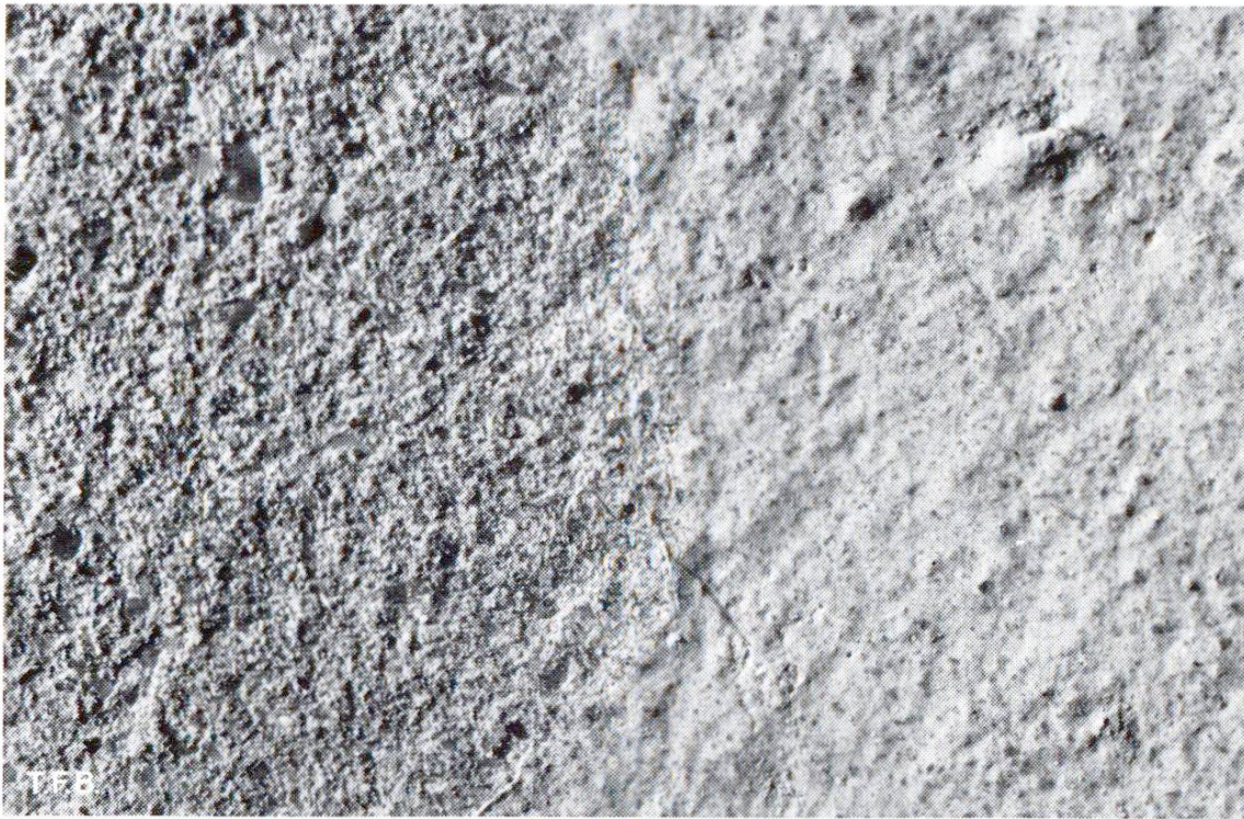
Fig. 1 Attaque de la chaux à la surface lisse d'un béton. Image agrandie. Largeur de la zone photographiée = 10 mm. A gauche, 2 mg/cm 2 de CaCO 3 ont été enlevés.