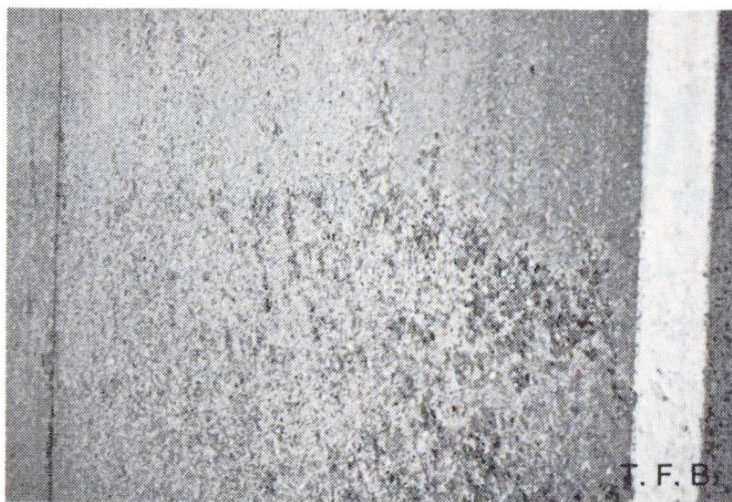
Fig. 1 Dégâts de gel en présence de sel sur une route en béton.