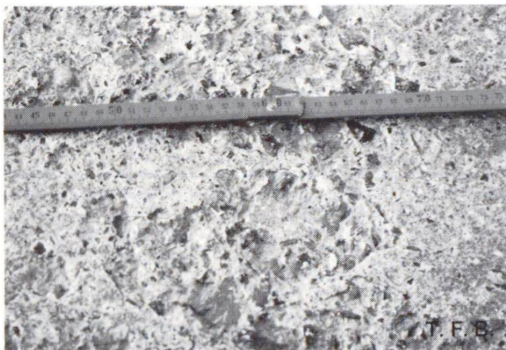
Fig. 2 Ecaillage par gel en présence de sel sur une marche d'escalier.