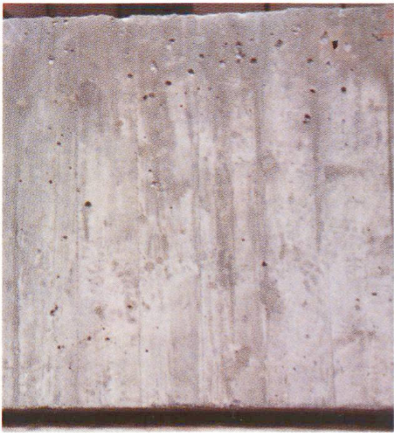
Fig. 3 Vue de près des échantillons 9/1/7/4/2 selon tableau 1.