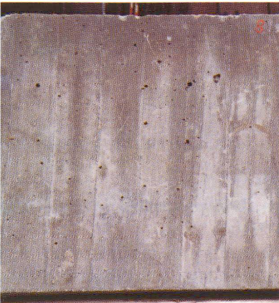
Fig. 2 Vue de près des échantillons 5/3/10/6/8 selon tableau 1.