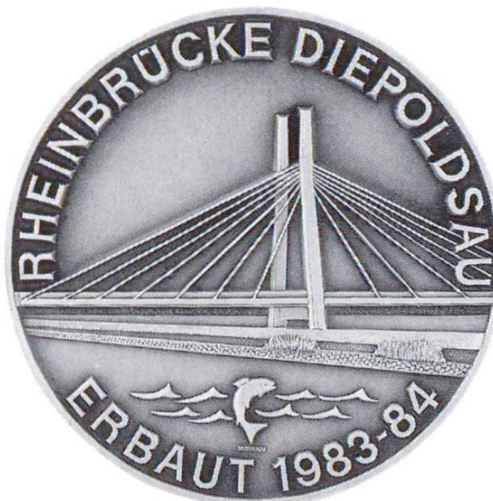
Pont sur le Rhin de Diepoldsau. Bureaux d'ingénieurs Bänziger + Partner: pont en voie d'achèvement et anniversaire du bureau (1984)