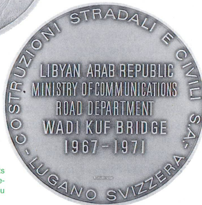
Pont Wadi Kuf. Ministère des transports de la République arabe de Libye et entreprise de construction: achèvement du pont (1971)