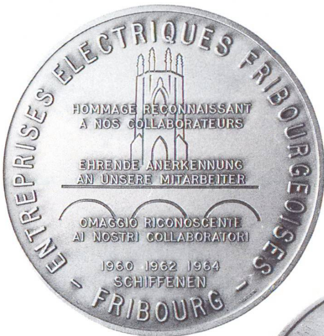
Centrale électrique de Schiffenen. Entreprises électriques fribourgeoises, Fribourg: hommage reconnaissant aux collaborateurs à l'occasion de l'inauguration (1964)