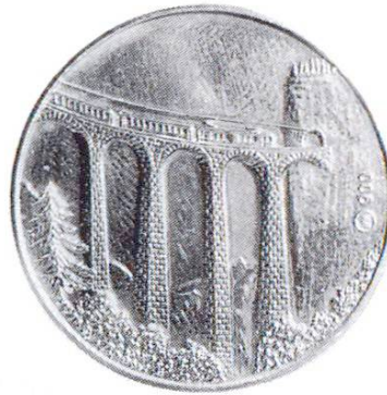
Viaduc ferroviaire. Chemins de fer rhétiques: 75 ans de la ligne de l'Albula (1978)