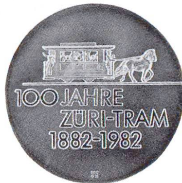
Tram zurichois. Transports publics de la ville de Zurich: centenaire des trams zurichois (1982)