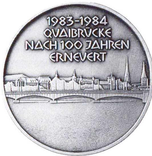
«Quai» Zurich. Office des travaux publics de la ville de Zurich: 100e anniversaire du pont et achèvement des travaux de rénovation (1984)