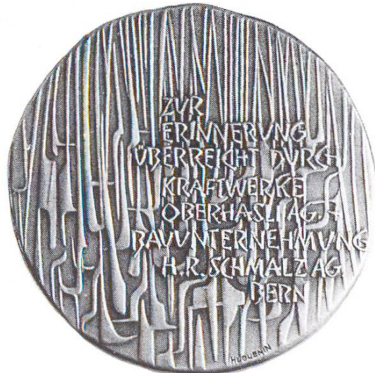
Galeries forcées de Hopflauen-Äppigerberg. Centrale électrique d'Oberhasli et entreprise de construction: percement (1966)