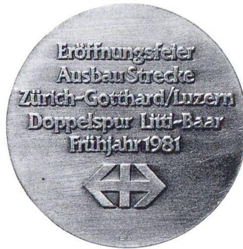
Viaduc franchissant la Lorze à Littli-Baar. Chemins de fer fédéraux: mise en service de la double voie (1981)