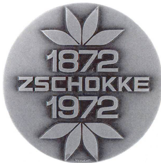
Image urbaine des années 70. SA Conrad Zschokke: centenaire de l'entreprise (1972)