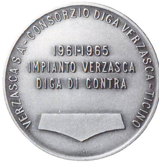
Barrage Diga di Contra (Lago di Vogorno). Verzasca SA, Lugano, et Consorzio Diga Verzasca: achèvement (1965)