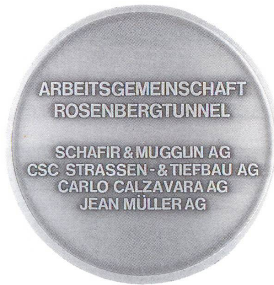
Tunnel de Rosenberg de la N1, St-Gall. Maître de l'ouvrage et Consortium Tunnel du Rosenberg: percement (1983)