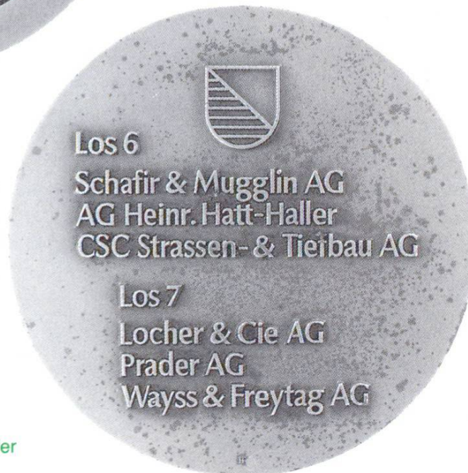
Tunnel de Hagenholz: Chemins de fer fédéraux: percement (1977)