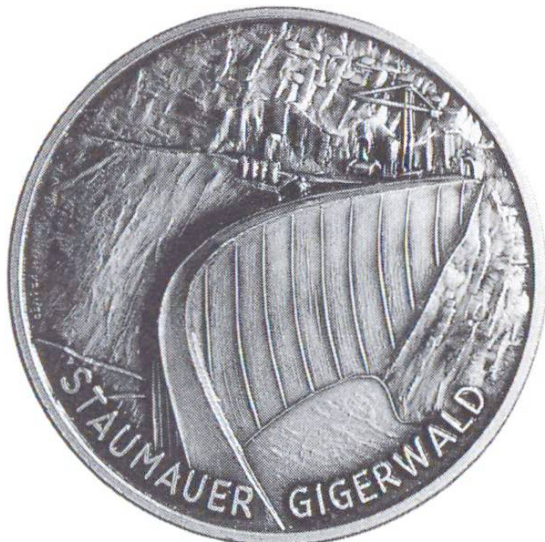
Barrage de Gigerwald. Kraftwerke Sarganserland AG et Consortium: achèvement du barrage (1976)