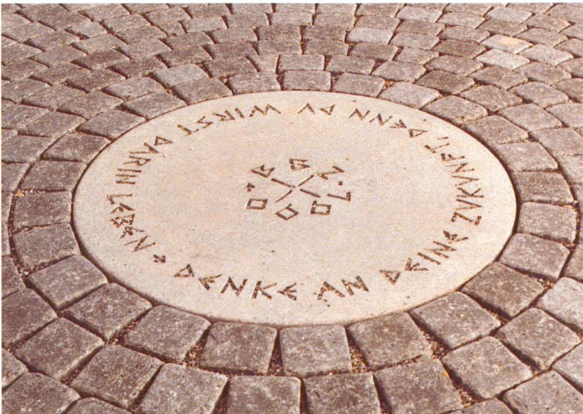
Fig. 7 La marqueterie est encore peu utilisée. Cette possibilité s'applique particulièrement aux grandes surfaces pavées. Médaille dans un complexe scolaire, portant la maxime: «Denke an deine Zukunft, denn du wirst darin leben.» BBZ, Granges