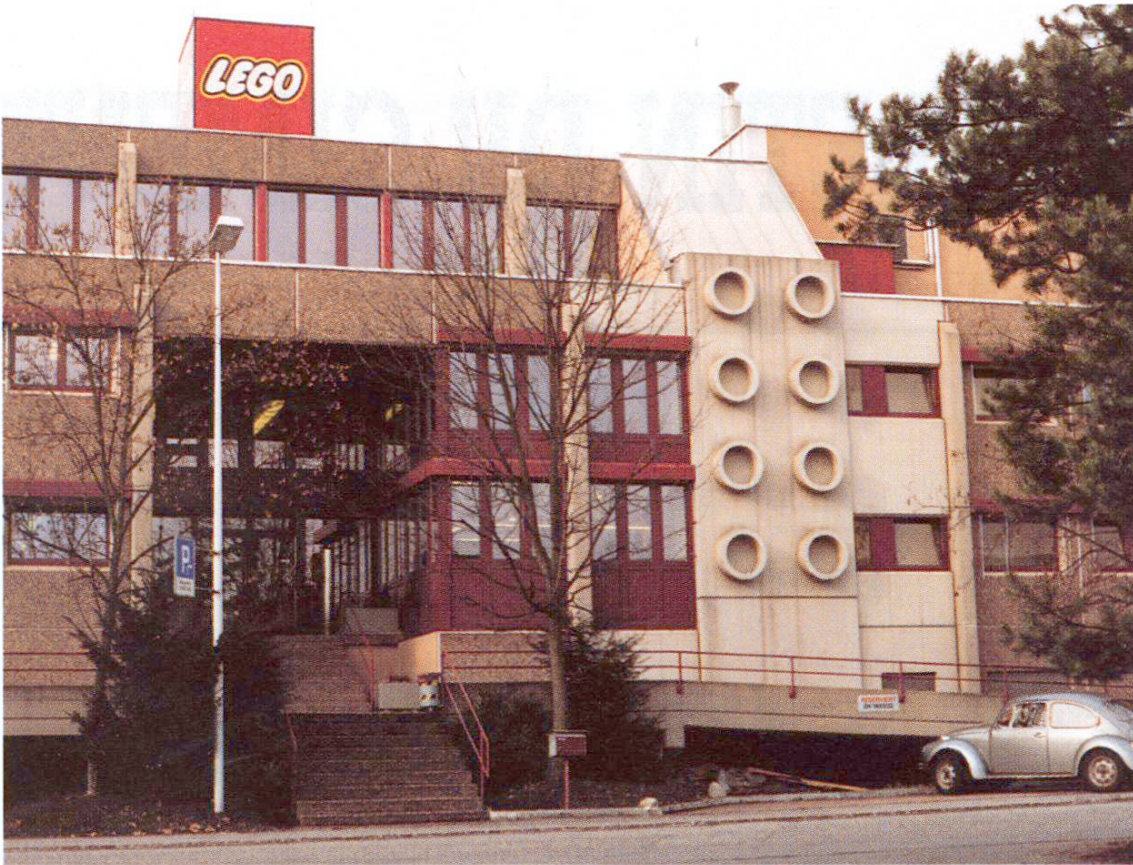
Fig. 1 Le logo n'est pas en béton. Mais on a stylisé un produit célèbre de la firme et on l'a utilisé comme élément de construction. Lego, Baar

démontrent. Les logos tout de même réalisés en béton témoignent d'un designer qui se sert de ce matériau avec créativité. Un designer qui met à profit les possibilités supplémentaires qu'offre le béton utilisé comme matériau de construction, qui sait veiller à ne pas rompre l'unité sans tomber dans la monotonie, attirer l'attention sans être tapageur, et faire preuve de fermeté sans passer pour une tête de mule. Ce dont il a toutefois besoin, c'est d'un profil au moins sommaire du maître de l'ouvrage.