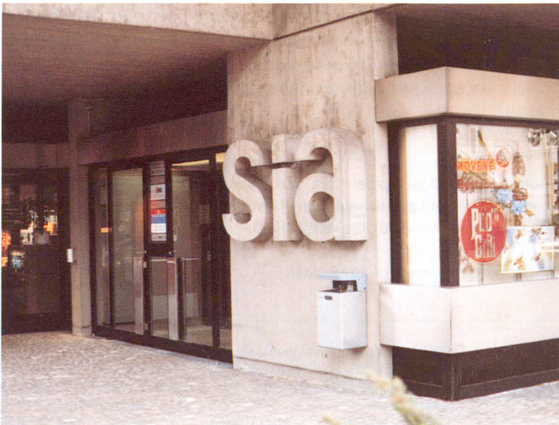
Fig. 3 Logo faisant référence au propriétaire, SIA Zurich