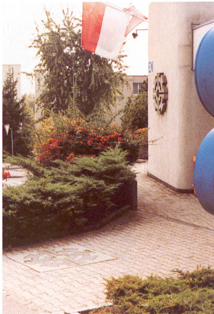
Fig. 6 Marque maison du premier propriétaire, fixée dans le mur. On retrouve la roue de moulin sur le sol de l'entrée, exécutée en marqueterie. Actuellement: Feldschlösschen, Granges

Fig. 7 La marqueterie est encore peu utilisée. Cette possibilité s'applique particulièrement aux grandes surfaces pavées. Médaille dans un complexe scolaire, portant la maxime: «Denke an deine Zukunft, denn du wirst darin leben.» BBZ, Granges