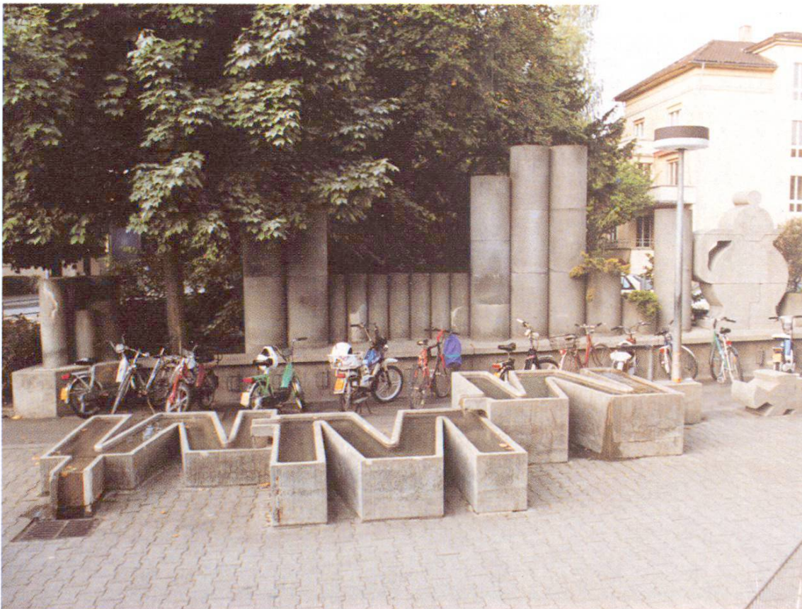
Fig. 5 Sculpture avec un logo pour sujet. Migros, Granges