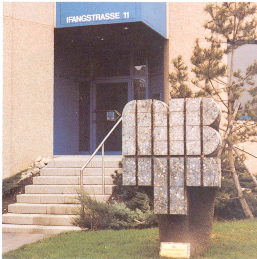
Fig. 4 Logo indépendant. MBT, Schlieren