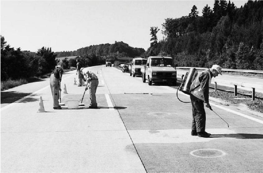
Essais préalables sur une chaussée en béton pour le traitement par imprégnation hydrophobe: application du produit d'imprégnation au pistolet ou au rouleau.