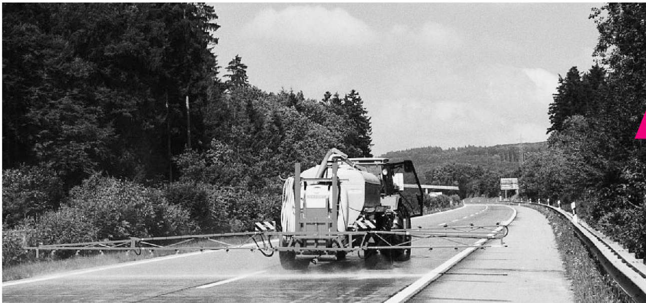
Imprégnation hydrophobe d'une chaussée en béton.