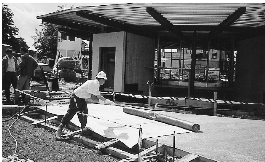
Recouvrement avec des nattes thermo-isolantes d'un revêtement en béton fraîchement mis en place.

Le jute, le coton et autres tissus absorbant l'eau conviennent pour la cure humide sur surfaces horizontales et verticales. Les tissus de jute doivent être rincés copieusement avec de l'eau avant l'emploi; cela élimine les substances solubles dans l'eau et augmente le pouvoir absorbant. Les recouvrements doivent être maintenus constamment humides, sinon ils peuvent extraire de l'eau du béton. En recouvrant en outre le tis-