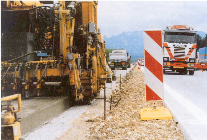
Fig. 3 Les chaussées en béton modernes sont mises en place avec des finisseuses à coffrage glissant.