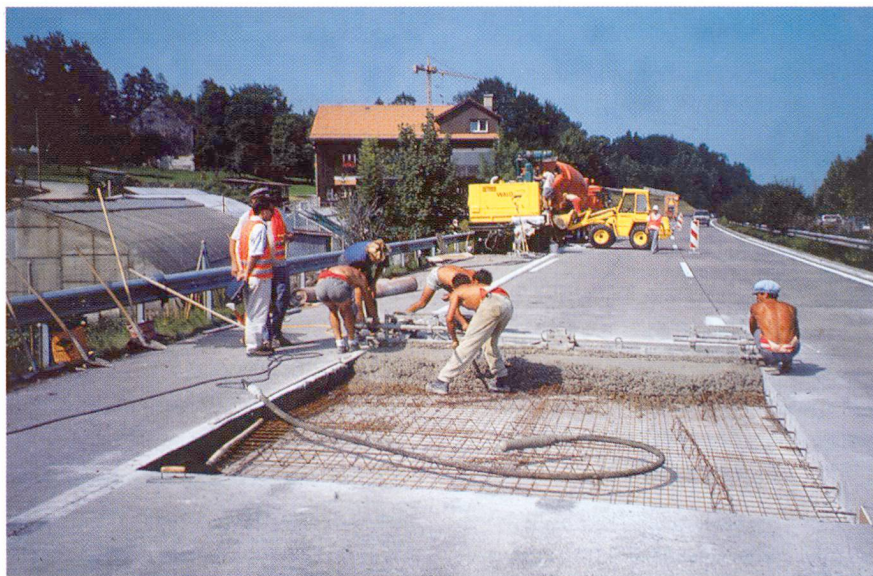
Fig. 5 Remplacement de dalles et utilisation de béton à haute résistance initiale en Suisse.

Pendant longtemps, on tenait pour acquis que les réparations des dégradations dans les revêtements bitumineux étaient rapides, alors que celles des chaussées en béton duraient relativement longtemps. C'est pourquoi souvent certaines dalles en béton dégradées ont été remplacées par du bitume, lequel se gondolait toutefois après peu de temps déjà, et provoquait parfois des blow-ups dans les bandes de chaussées contiguës. Ces temps sont révolus. Aujourd'hui, les dalles de revêtements en béton sont remplacées partiellement ou