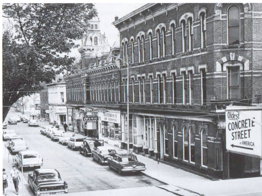
Fig. 1 La première route en béton moderne a été construite en 1894 à Bellefontaine, dans l'Ohio (USA). Elle est en service aujourd'hui encore!

La haute qualité des routes en béton de la troisième génération peut être vérifiée sur le tronçon Haag-Trübbach de la A13, réalisé en 1979. Depuis sa mise en service voici 20 ans, on n'y a pas constaté de dégradations. Seul l'entretien usuel – renouvellement du mastic d'obturation des joints – a été effectué 15 ans après l'ouverture à la circulation. Cela vaut également pour les tronçons d'autoroute (Walensee et Oberriet-Haag) construits depuis 1979 dans le canton de St-Gall.