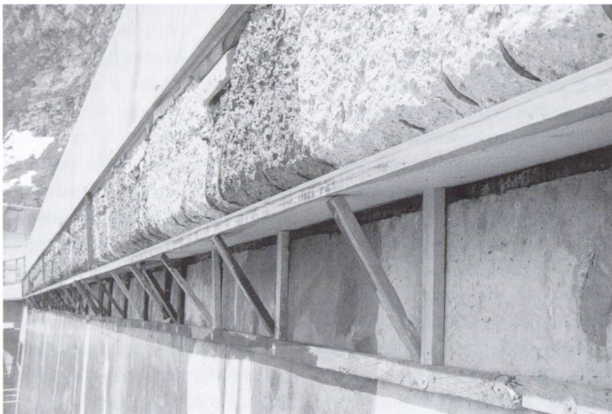
Console du parapet d'un couronnement de mur de barrage prête pour la projection (ancien béton piqué et coffré).

Mais les entrepreneurs qui ont cru qu'il suffisait d'acheter une installation pour la projection et des mélanges prêts à l'emploi ont causé bien des dégâts. Teichert a dit à ce propos [3]: «Dans ce pays, quelque chose est allé de travers avec les travaux de projection avec des mélanges en sacs. Cela a remis le béton projeté en question et ranimé des doutes et des préjugés péniblement dissipés.»