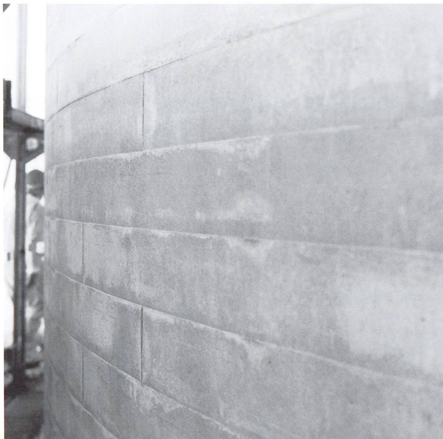
La surface en béton projeté du mur cintré de la nef de l'église St-Charles de Lucerne a été dotée d'une structure de béton coffré.