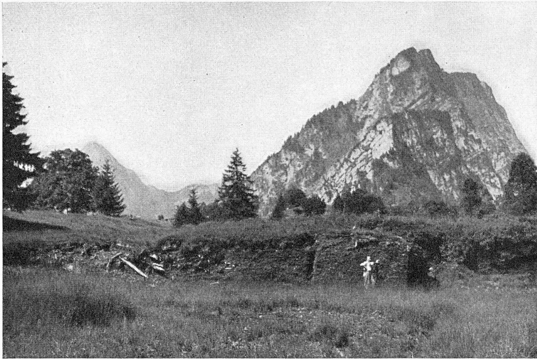
Fig. 10. Tourbière de Bocken: partie exploitée. A gauche beaucoup de bois intercalé dans la tourbe.

A partir du sous-sol minéral, jusqu'à la surface l'acidité augmente plus ou moins régulièrement, correspondant aux associations végétales qui se sont succédées durant l'évolution de la tourbière. Pour celles qui ont formé la tourbière basse, tourbe d'Hypnacées et de radicules, le pH est moindre que pour la tourbière haute, tourbe de Scheuchzeria de Sphagnum et de Sphagnum-Eriophorum pour laquelle le pH devient plus tard assez égal.