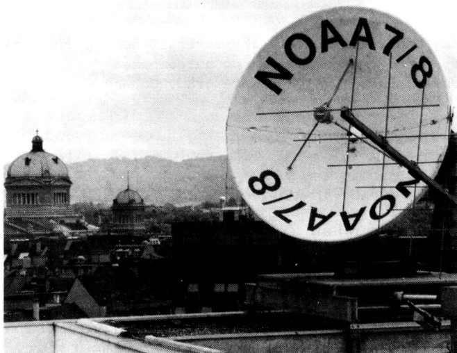
Auf dem Dach des Instituts für Exakte Wissenschaften befindet sich eine Parabolantenne von 3 m Durchmesser. Sie ist dreh- und schwenkbar montiert und dient zum Empfang von digital codierten Signalen von Satelliten der NOAA-Serie

Die Erfassung der nördlichen bzw. südlichen Breiten unseres Planeten erfordert den Einsatz einer 2. Gruppe von Satelliten mit völlig anderen Bahnparametern. Mit einer Inklination von ca. 100 Grad (Winkel zwischen Satellitenbahn und Äquatorebene) und einem Bahnradius von ca. 7'500 km bewegen sich diese Flugkörper in rund 100 Minuten auf einer polaren Umlaufbahn einmal um die Erde. Da sich die Erde unter der Satellitenbahn wegdreht, überfliegen sie dieselbe Region auf der Erdoberfläche etwa alle 12 Stunden. Wegen der geringen Flughöhe (ca. 980 km über der Erdoberfläche) gewähren sie eine wesentlich bessere Auflösung (1 x 1 km pro Bildpunkt). Allerdings ist der Empfang der Signale aufwendiger als für geostationäre Satelliten, da nachführbare Antennen nötig sind.