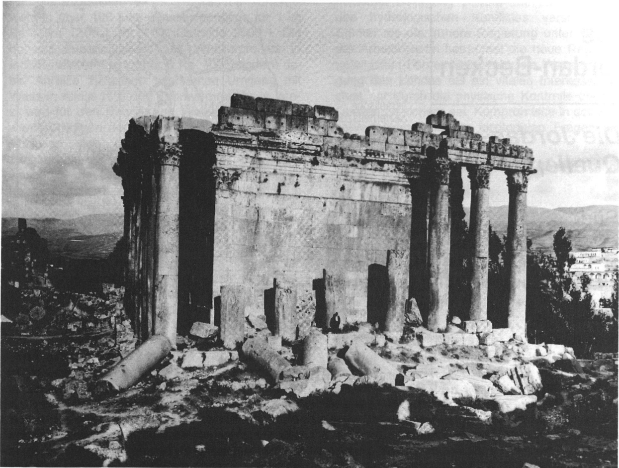
Abb.: Baalbek - eine Ruine, die jede/r kennt, und die Siedlung im Hintergrund? Um 1900.