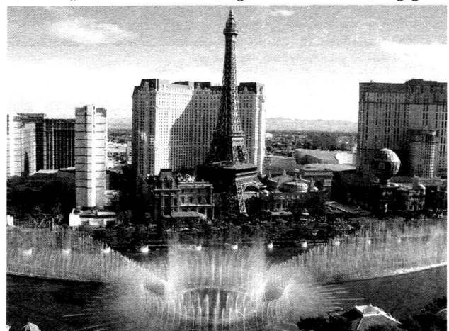
Abb. 1: Fontäne des Hotels Bellagio in Las Vegas

Die grösste Nachbildung des Realen findet sich in Las Vegas mit jährlich über 35 Millionen Besuchern. Die Geschichte der Stadt ist von je her eng mit der Ressource Wasser verknüpft. Der Bau der Eisenbahn 1905, die Aufhebung des Anti-Gambling Law 1939 und vor allem der Bau des Hoover-Dam zu derselben Zeit ebneten den Weg für die Entwicklung „Fun City“ Las Vegas. Der aufgestaute Lake Mead lieferte in den kommenden Jahren und Jahrzehnten sowohl das Wasser als auch den Strom für die „Glitzerwelt“ Las Vegas. Der Bauboom gigan-