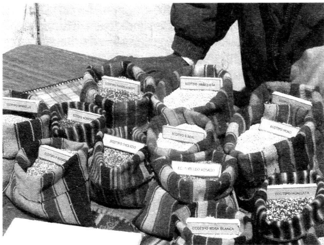
Abb. 2: Die Region hat eine Vielzahl einzigartiger Kulturpflanzen hervorgebracht darunter die Vielfalt der reichhaltigen Quinoa Sorten